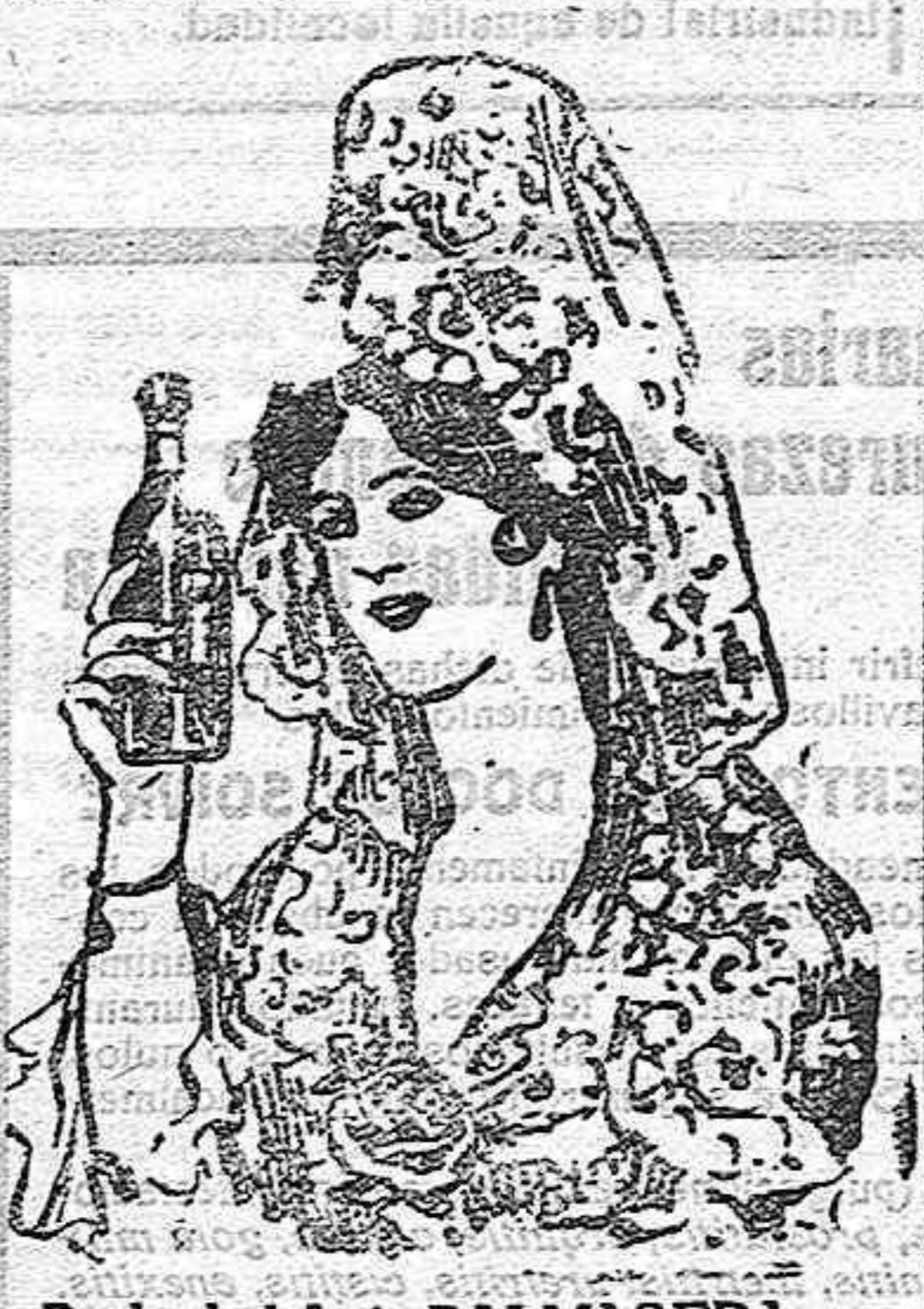
Probad el Anti BALSAMEDA y os convenceréis que es el mejor entre los que se conocen.