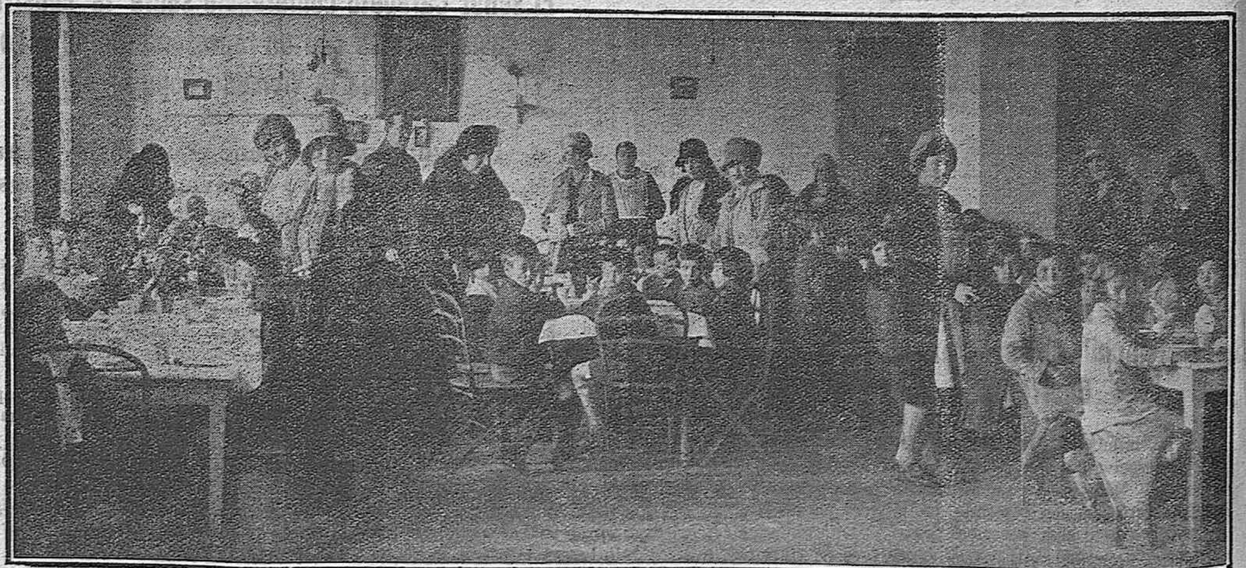
Esta fotografía, donde distinguidas señoras y señoritas de la capital prodigan consuelos a los niños, es una escena viva que debe servir de ejemplo a todos los que sientan amor y cariño por la niñez desvalida.

¿Por qué no se lleva a cabo aquí lo que en otros establecimientos similares realizan las se-