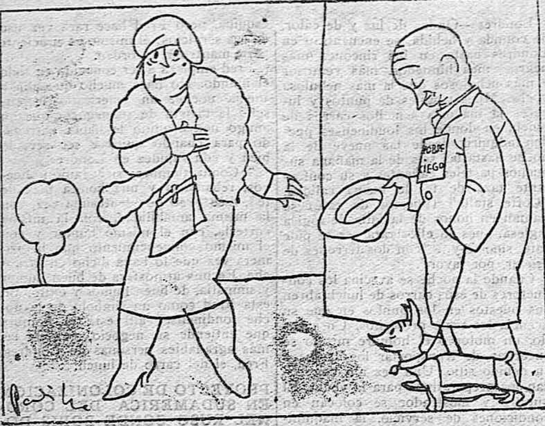
PRESUNCION —Una limosna para un pobre ciego, hermosa señora! —Este es ciego de los que ven!