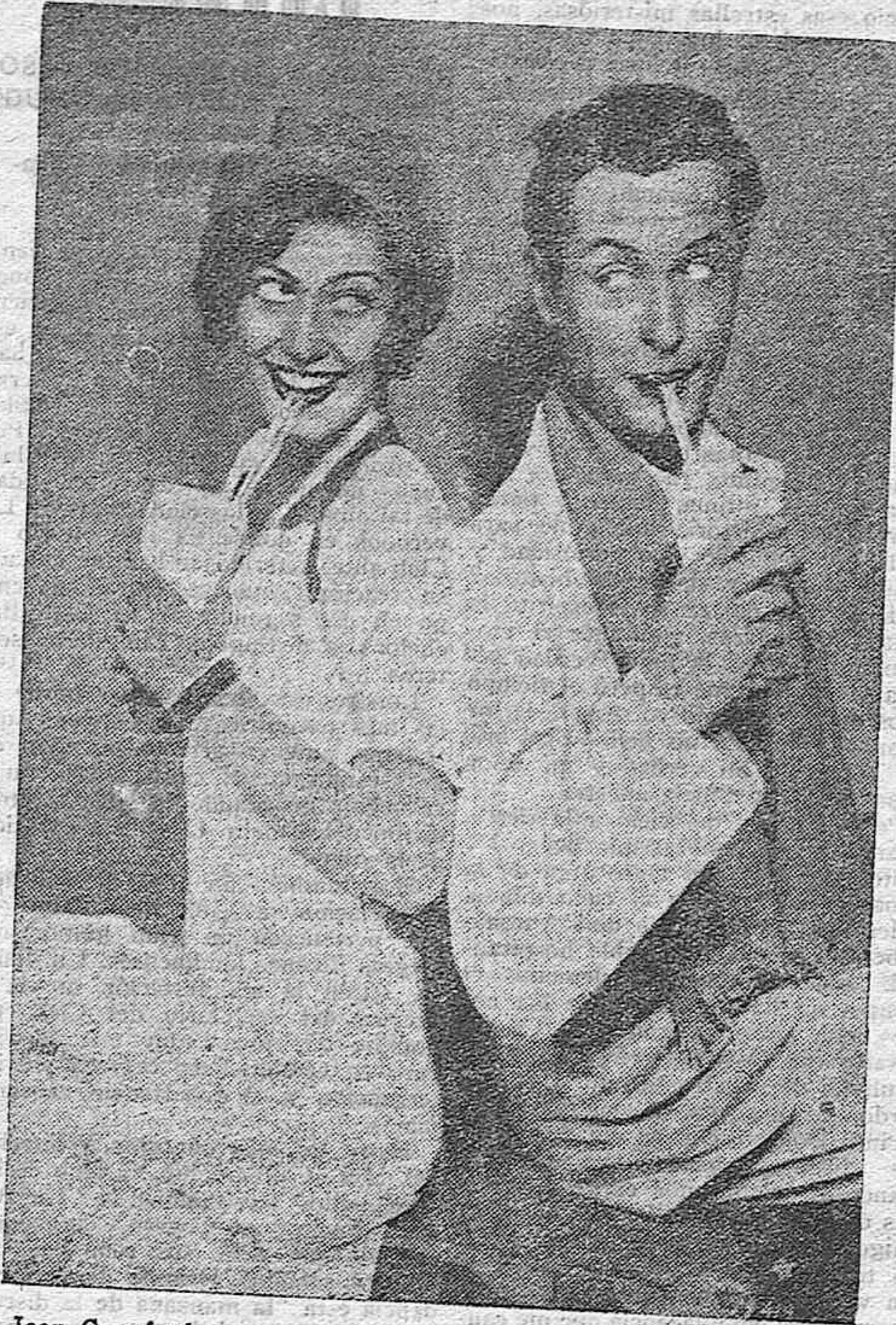
Joan Crawford, esposa de Fairbanks, hijo, y Robert Montgomery, en un descanso, toman helados y ensayan escenas cómicas que más tarde han de filmar.