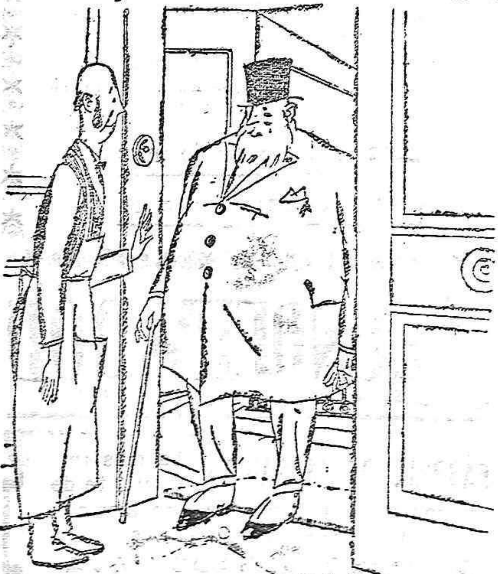
—Soy el doctor que han mandado llamar con urgencia. El criado.—Pues lo siento mucho, pero el señor está muy grave y no puede recibir a nadie.

Juan Esteban se encuentra en estado gravísimo.