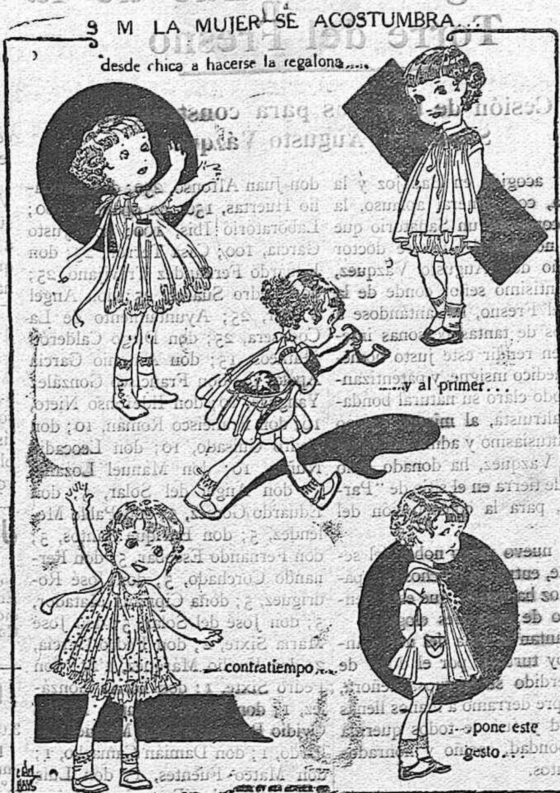
LA MUJER SE ACOSTUMBRA desde chica a hacerse la regalona...

El Club que en los momentos actuales casi duplica el número de socios que tuviera en épocas anteriores de mayor apogeo, se halla a punto de ultimar las ges ciones con los jugadores necesi rios para cubrir los dos o tres puestos que aún se hallan va cantes en su equipo, pudiendo ase gurarse que los elementos que le quitó el título que detentaba. El Arenas y el Athletic bilbaíno eran, no sólo los dueños del fut bol vasco, sino que incluso del once capaz de competir con los de de España, pero surgió un De más prestigio de otras regiones.