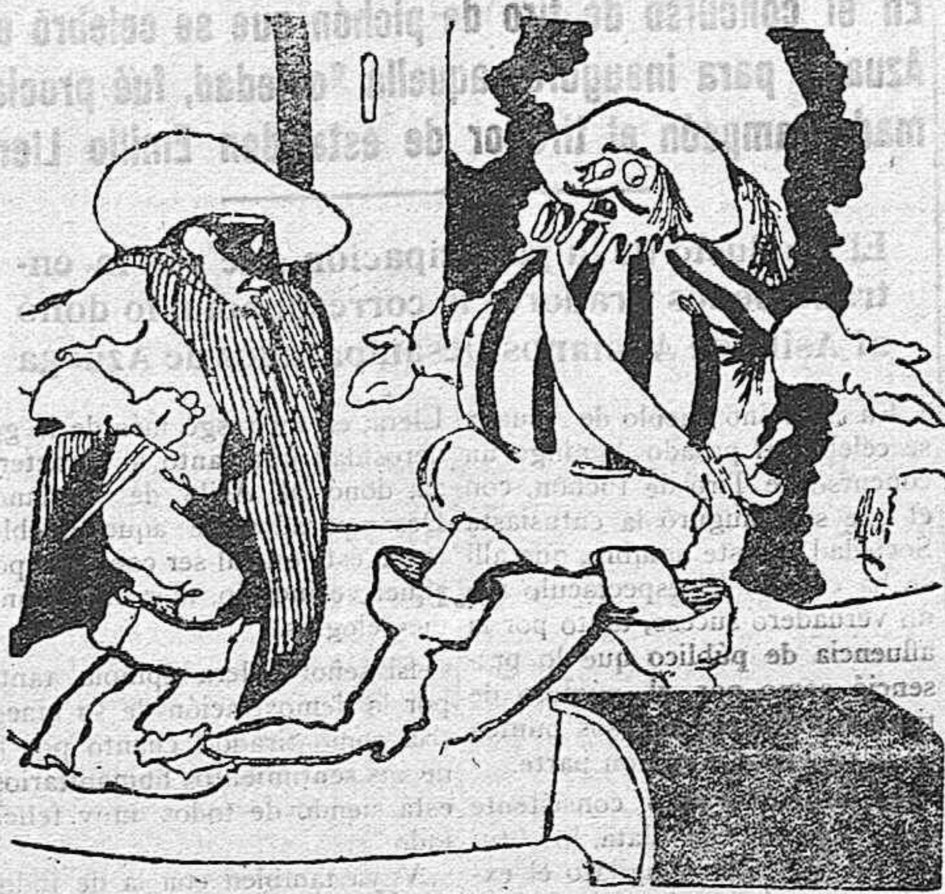
El actor (en voz baja a su compañero).—¡Mátame, sin preguntarme nada, que no me acuerdo del papel!