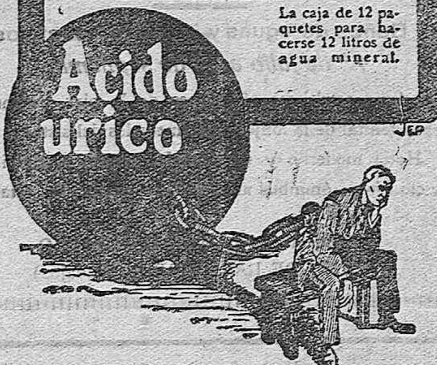
La caja de 12 paquetes para hacerse 12 litros de agua mineral.

Así se curará rápidamente todas las afecciones dolorosas que tengan como origen este veneno: el ácido úrico. REUMATISMOS, GOTA, PIEDRA.