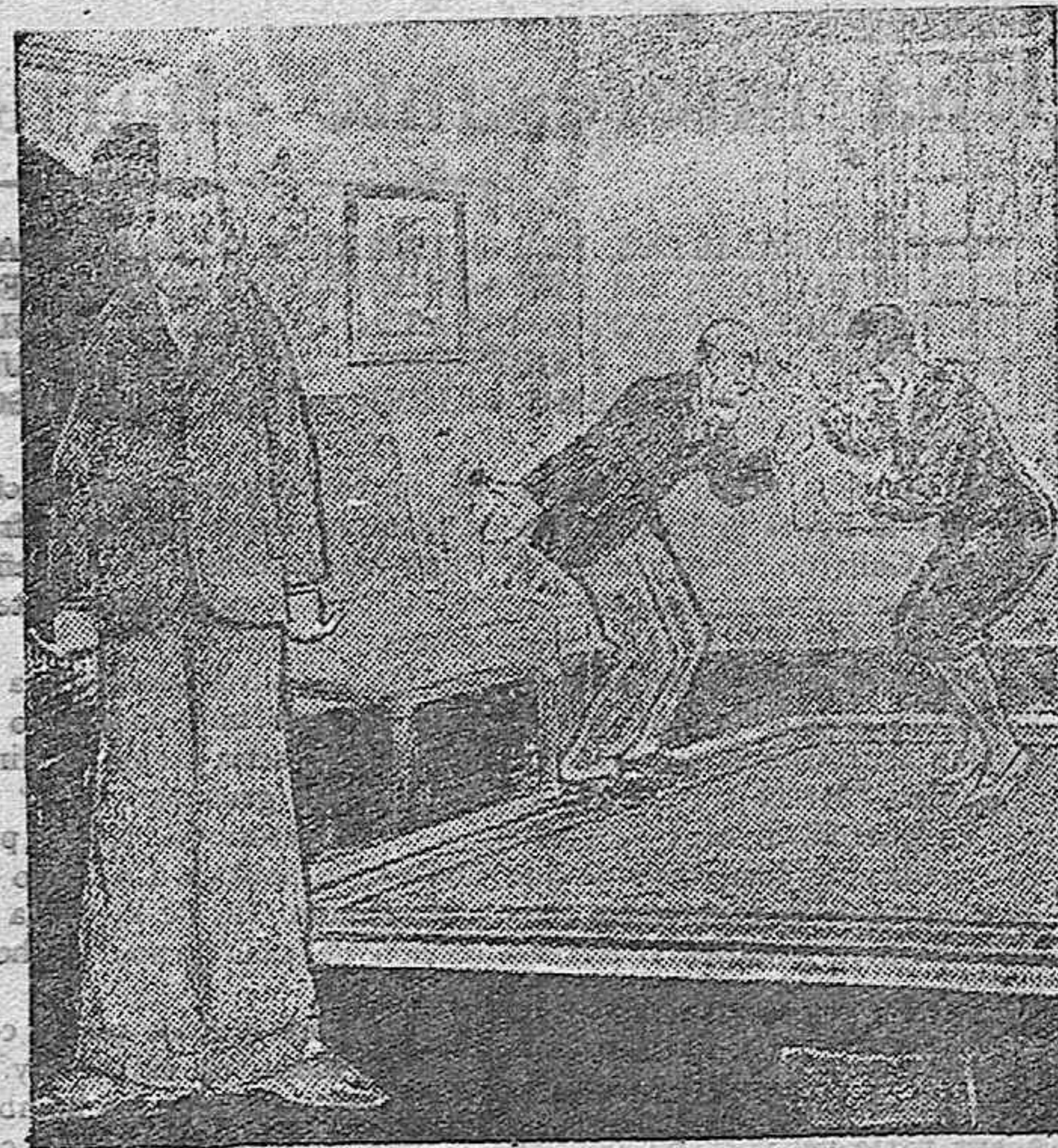
¿Se estarán pegando, o aprendiendo a bailar el "charlestón"?