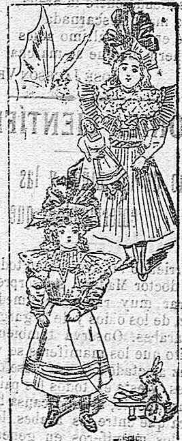
Trajes para niñas de 3 y 5 años respectivamente.

Modelos exclusivos para nuestras lectoras, de los grandes almacenes de EL SIGLO, Barcelona (I).