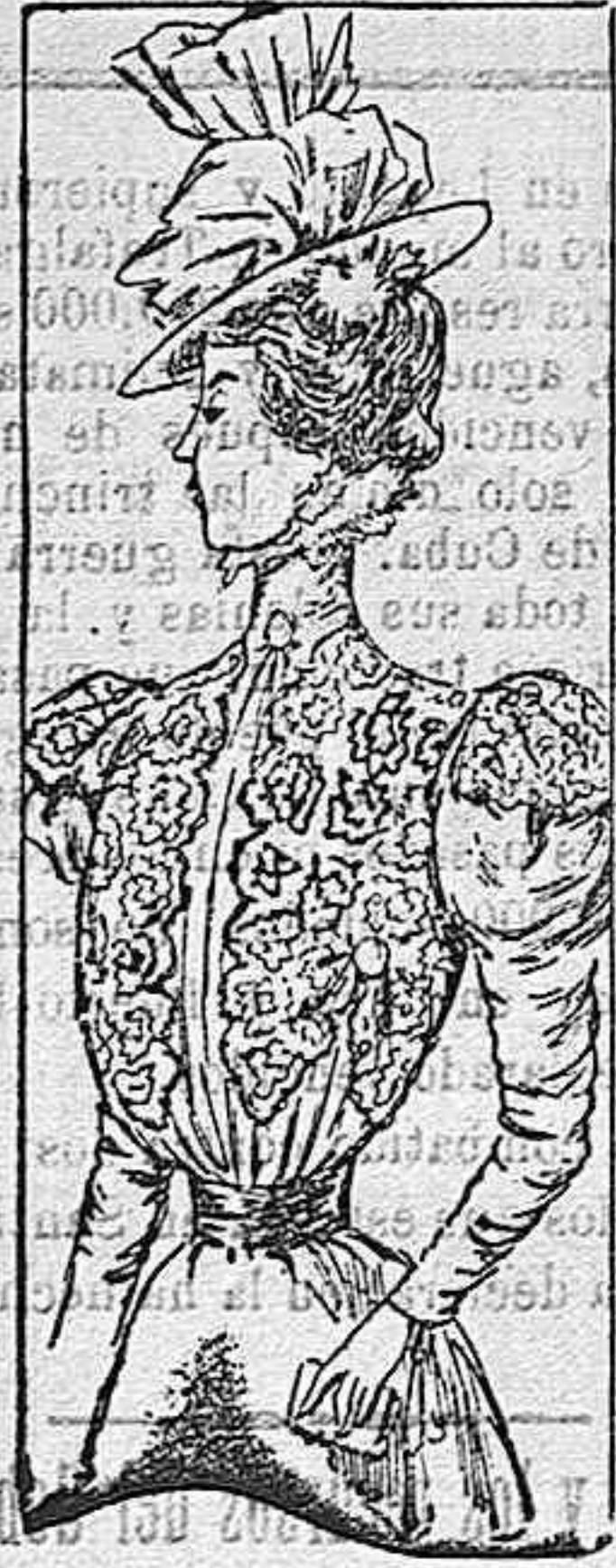
Blusa para visita.

Modelos exclusivos para nuestras lectoras, de los grandes almacenes de EL SIGLO , Barcelona (1).