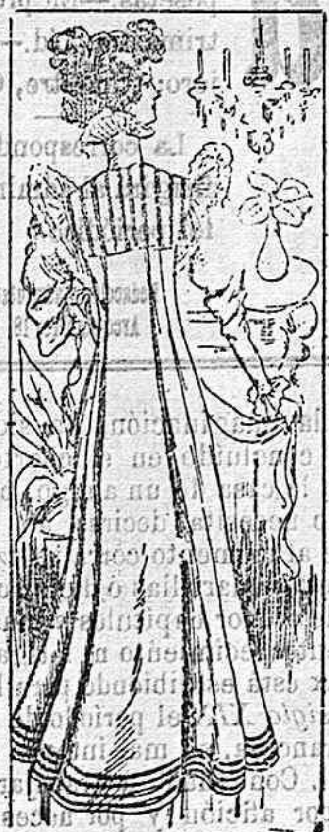
Bata fin de siglo

Modelos exclusivos para nuestras lectoras, de los grandes almacenes de EL SIGLO, Barcelona (I).