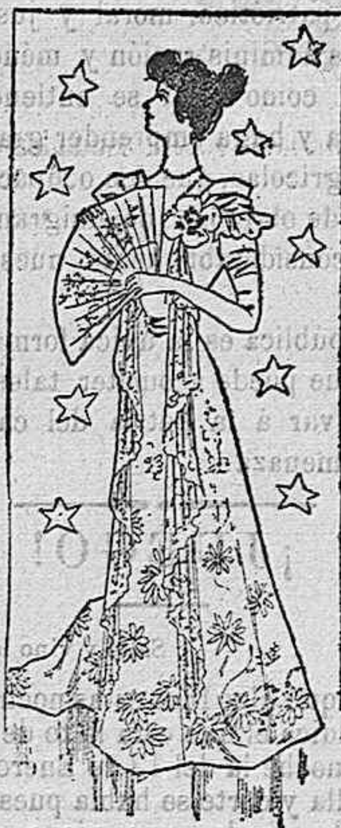
Bata para invierno.

Modelos exclusivos para nuestras lectoras, de los grandes almacenes de EL SIGLO, Barcelona (1).