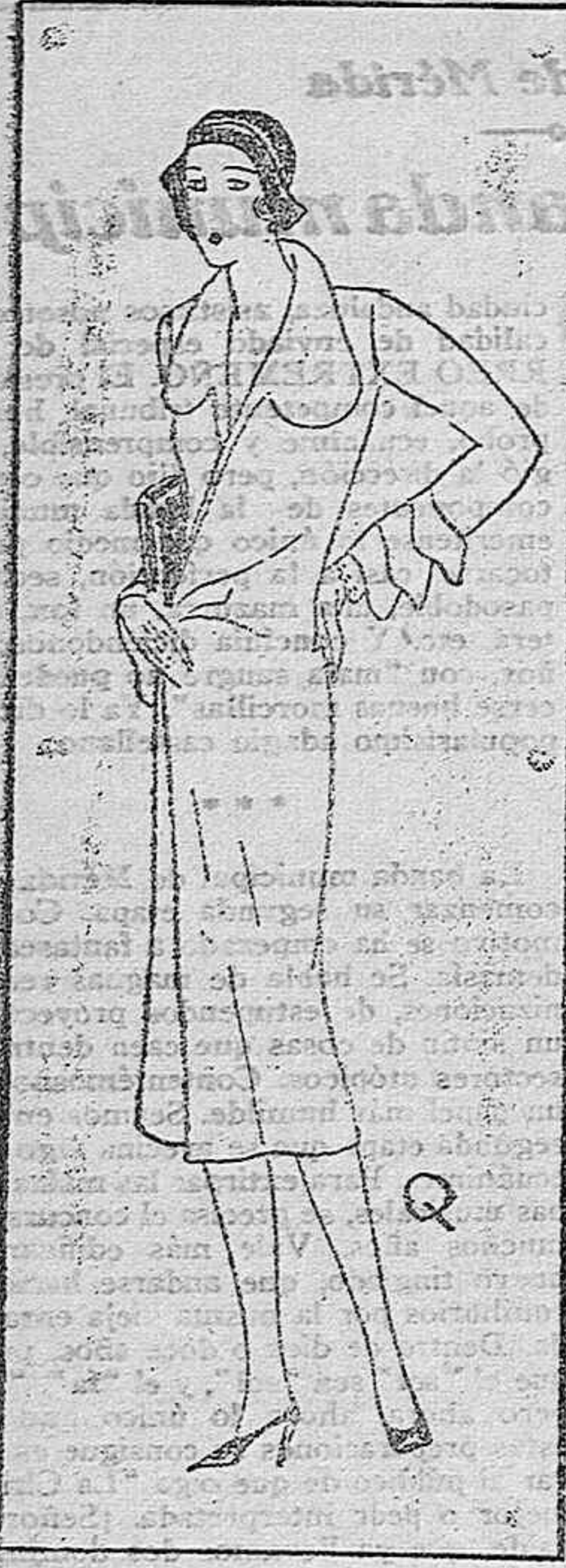
Abrijo de entretiempo para cubrir los ligeros vestiditos de la actual temporada