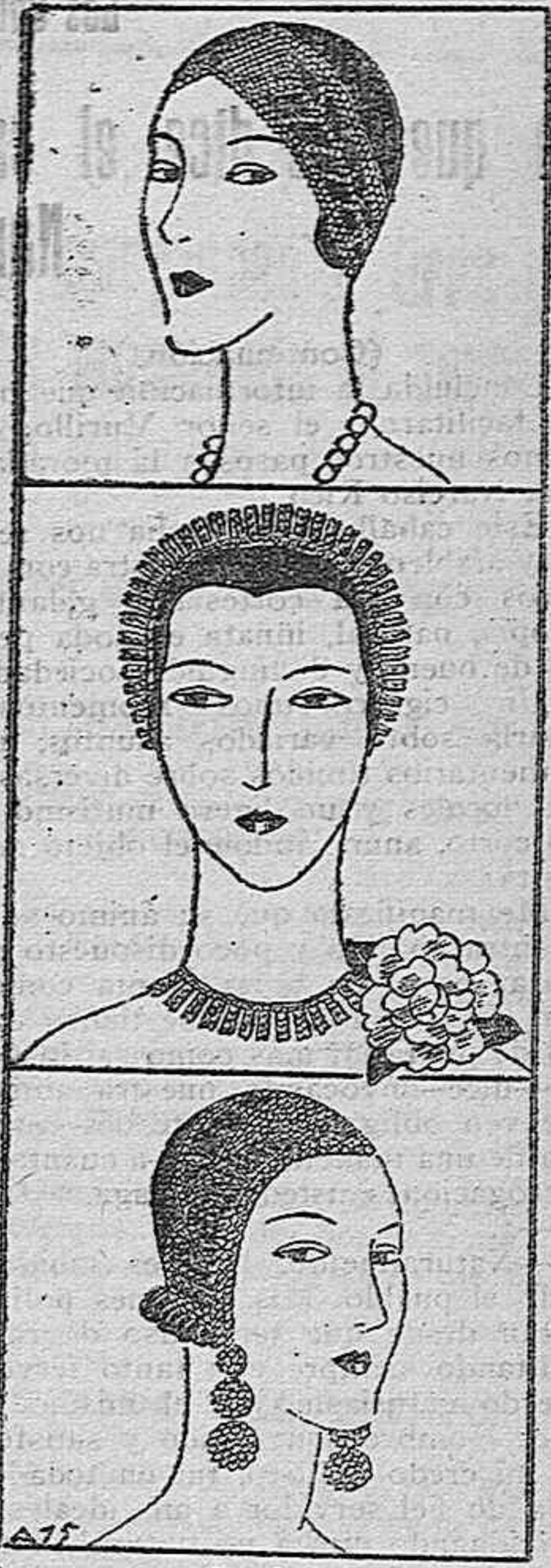
Tres notas de la moda actual

En uno de los abancalados se veía un montón de conejos tomando el sol. Ellos también saben que los rayos solares son buenos.