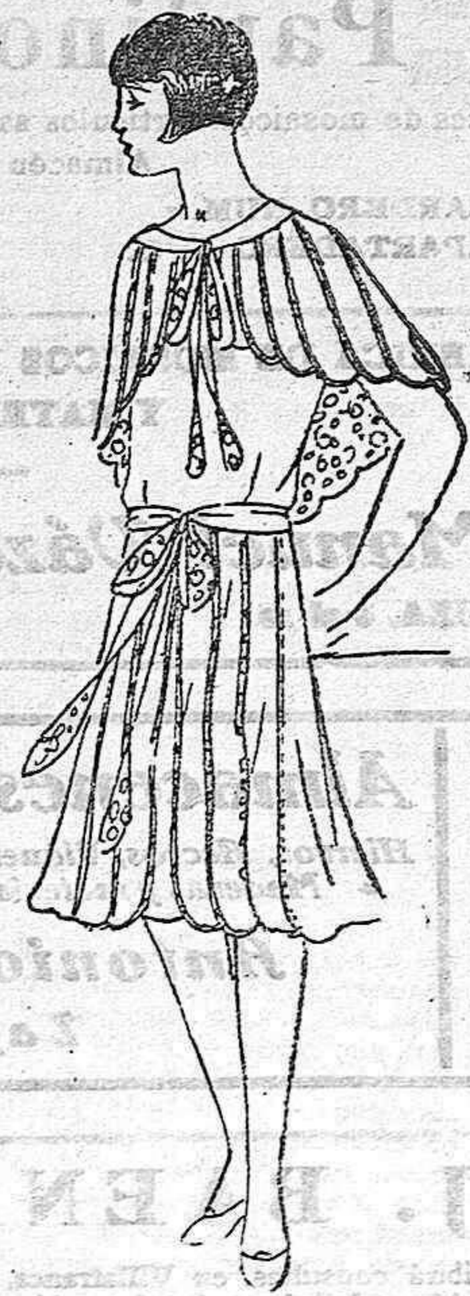
Vestido de tarde, para jovencita

La belleza y la utilidad en el arte, y la belleza y la salud en la persona, son a menudo confundidas erróneamente por los que, en teoría, se dedican a la difusión de ambos temas. Estos mal llamados apóstoles de una doctrina, pretenden hacernos creer que una gran fábrica, sólidamente construida, bien ventilada, con suficiente luz y llenando prácticamente todos los requisitos para que ha sido proyectada, merece el calificativo de bella, con tanta justicia como lo puede merecer un templo griego. Y del mismo modo hay devotos entusiastas de la cultura física que afirman que toda persona saludable puede ser considerada como bella.