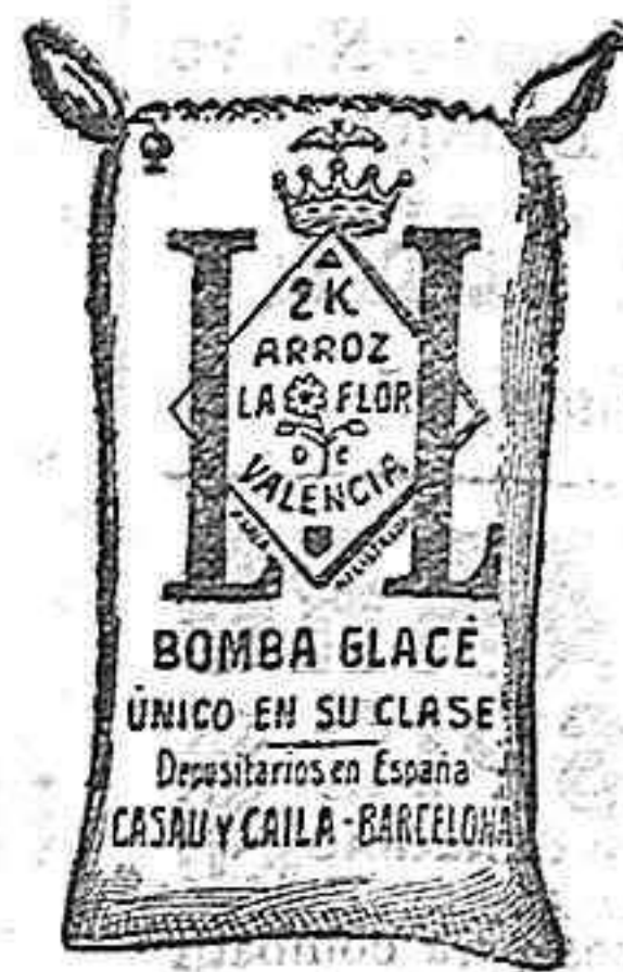
Arroz Glacé (2 Kilos)