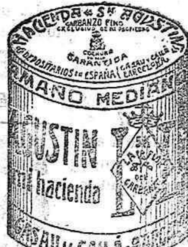
Garbanzo Sauco (5 Kilos)