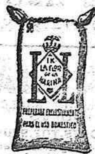
Harina Trappe (1 Kilo)