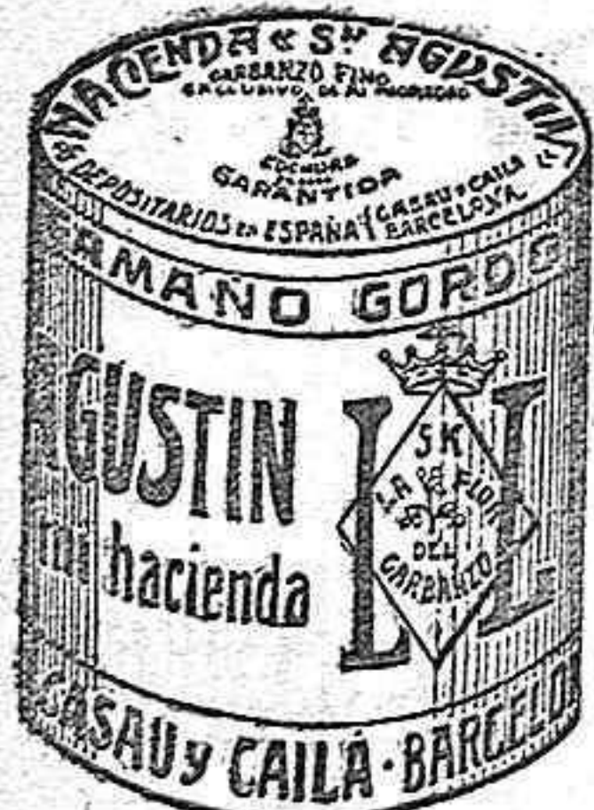
Garbanzo Sauco (5 Kilos)

Bastan tres fricciones para hacerla desaparecer por completo. Exito garantizado. No huele, ni mancha. Eficaz en toda clase de granos Pesetas 1'50 y 2 por correo.—Depósito, En Castuera en casa del autor A. Camacho.—Badajoz, Navarro. De Gabriel, 4.—Mérida: A. Rubio.—Murid, Martín y Durán.