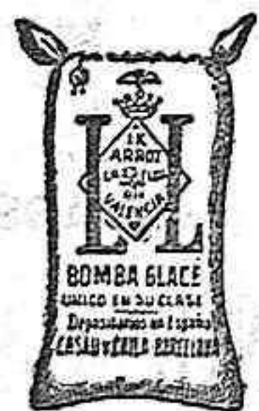
Arroz Glacé (1 Kilo)