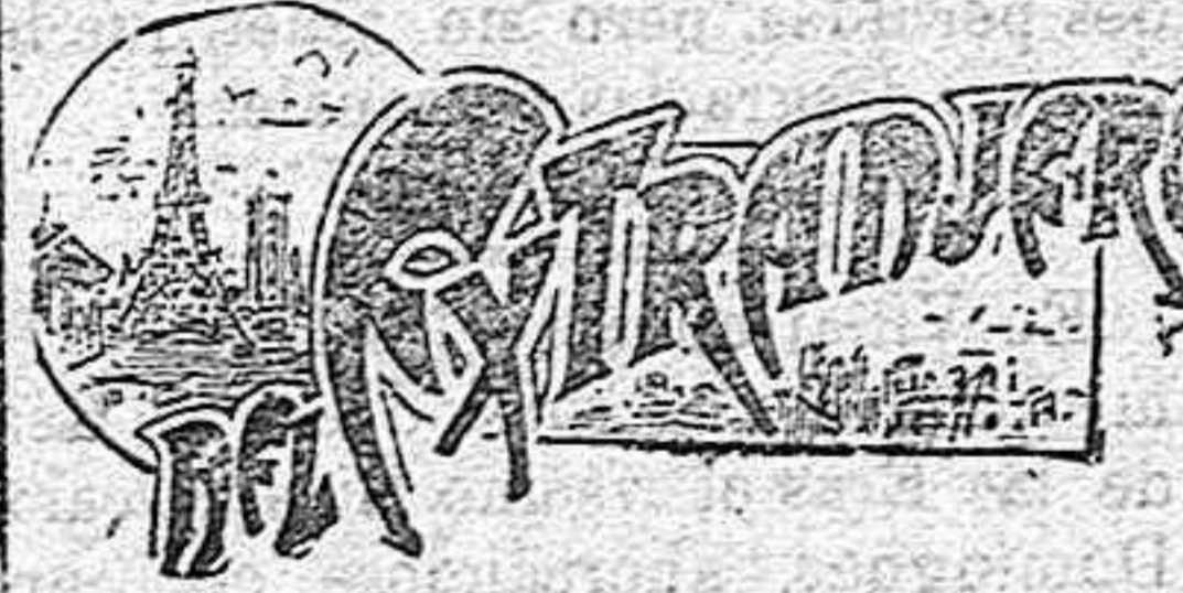
(DE NUESTRO SERVICIO ESPECIAL)

Ya será tiempo de que, con esos datos, se ponga de una vez orden en los Pósitos y se reorganice esa benéfica institución, que tan importante ayuda puede prestar a los pequeños labradores, si se le arranca de las manos del caciquismo rural.