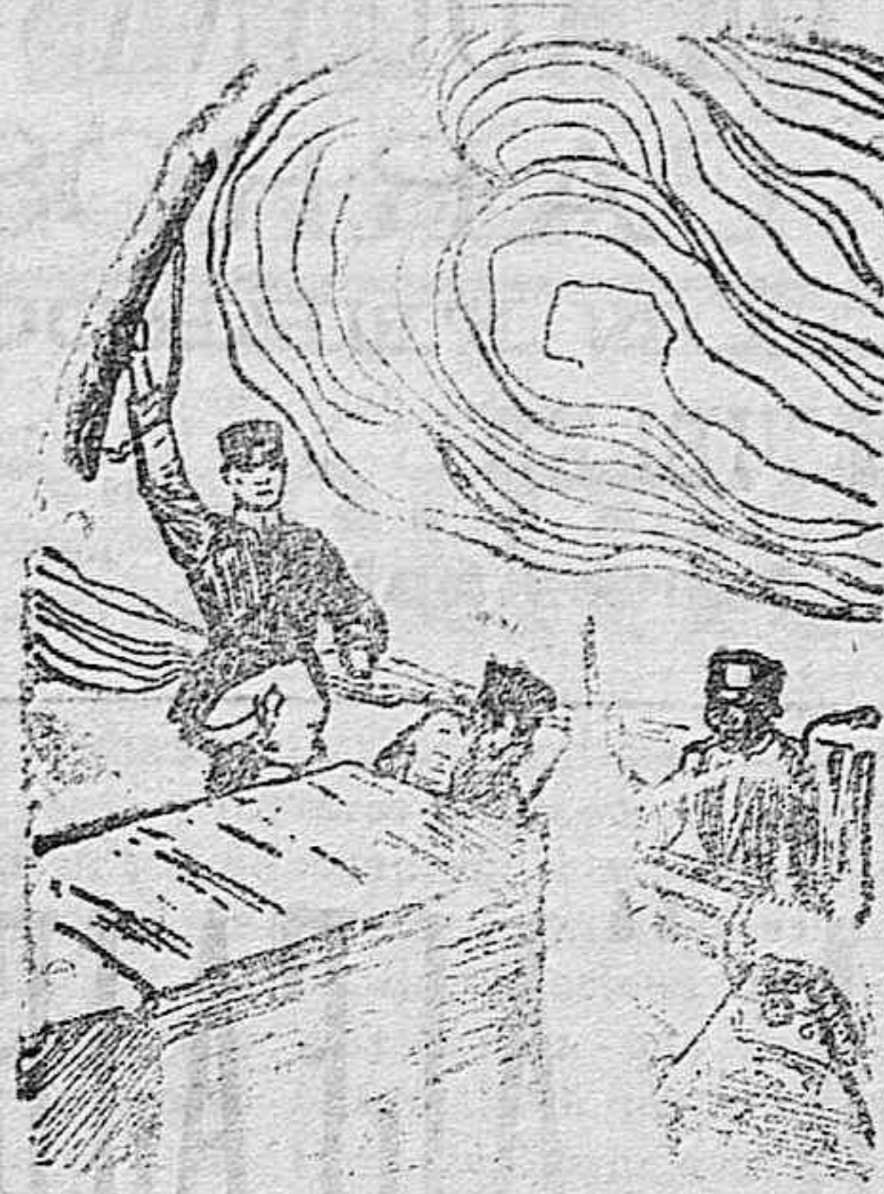
Asalto de uno de los baluartes que defienden á Port-Arthur.