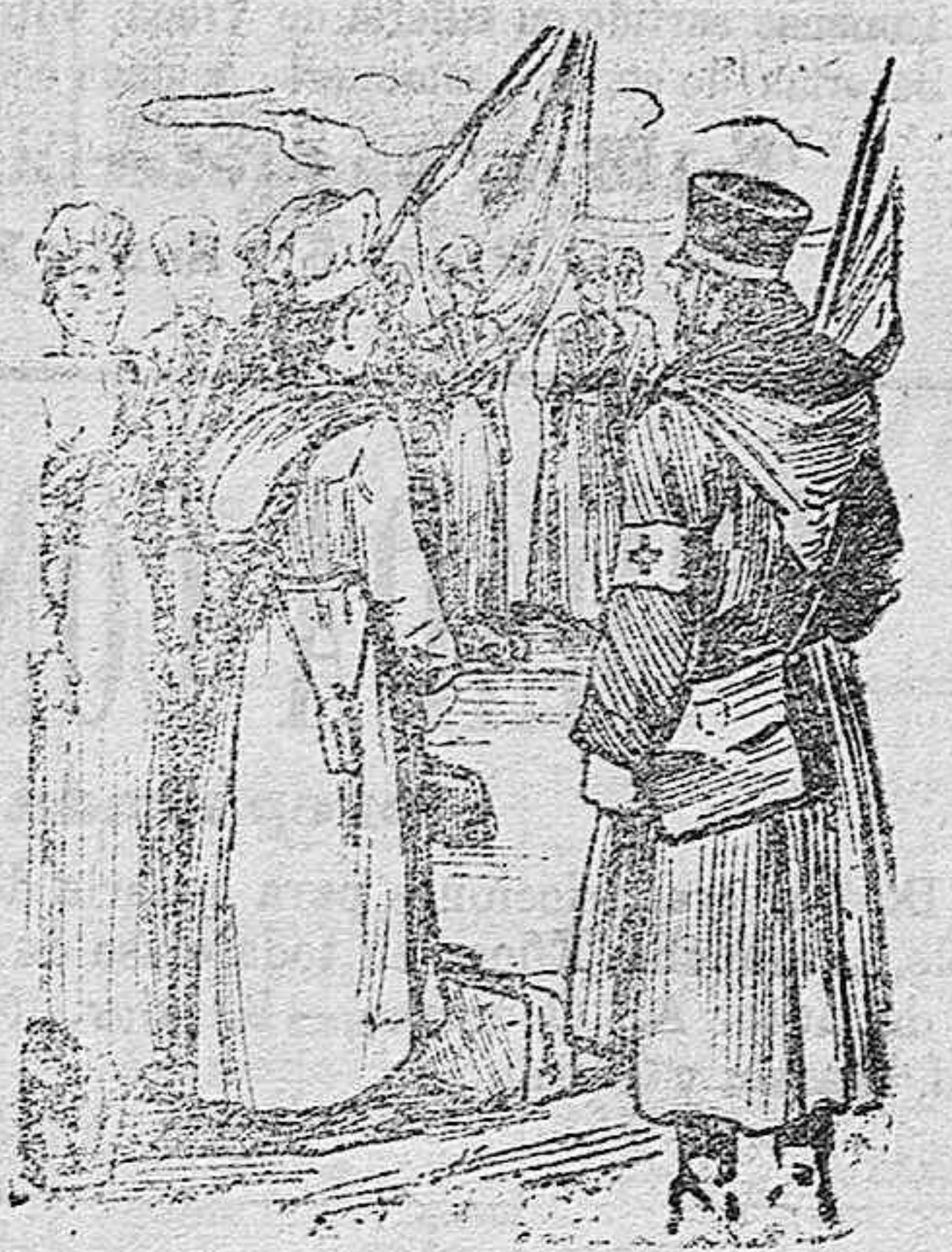
Ambulancias ruso-japonesas de la Cruz Roja.