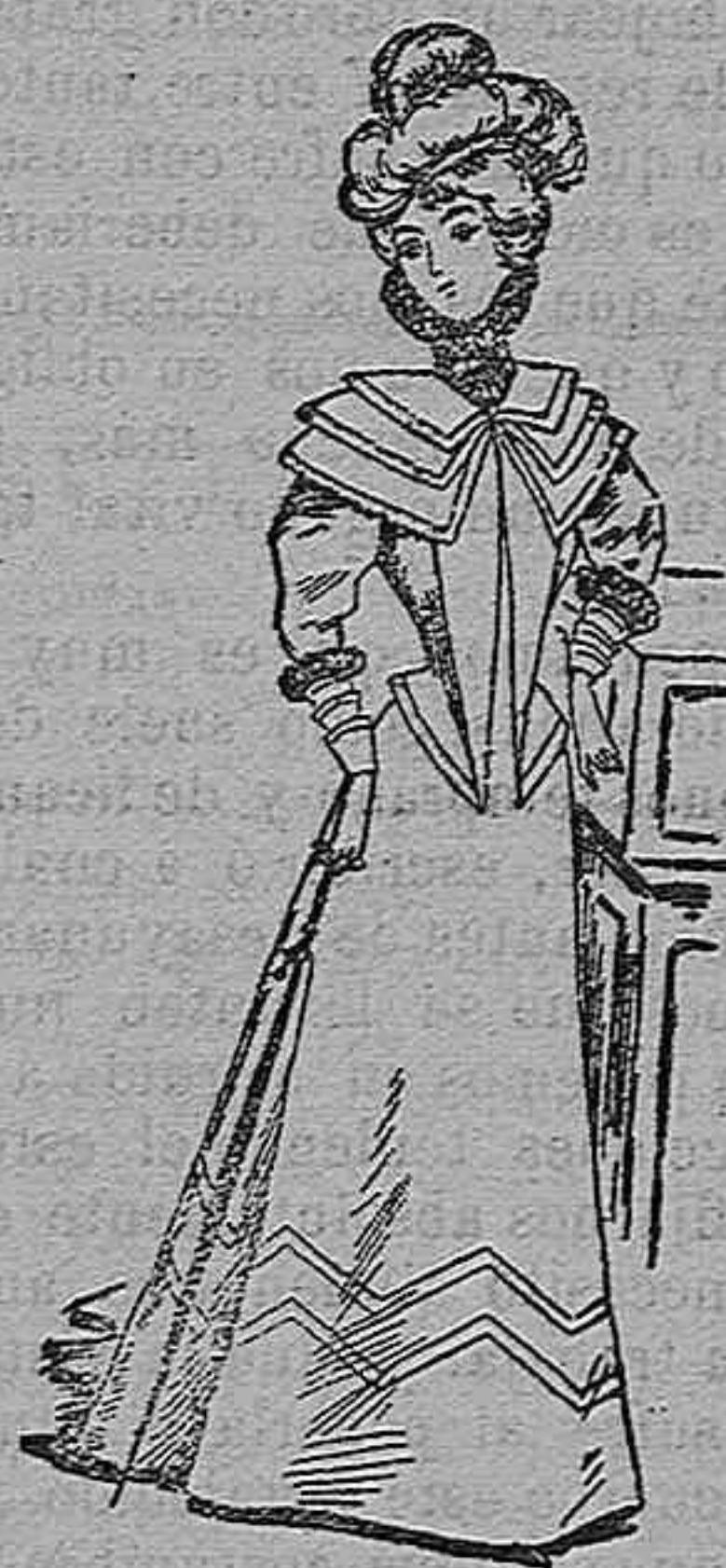
Traje para visita.

Modelos exclusivos para nuestras lectoras, de los grandes almacenes de EL SIGLO, Barcelona (1).