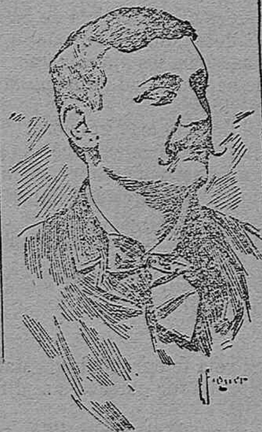
Benito Pérez Galdós.