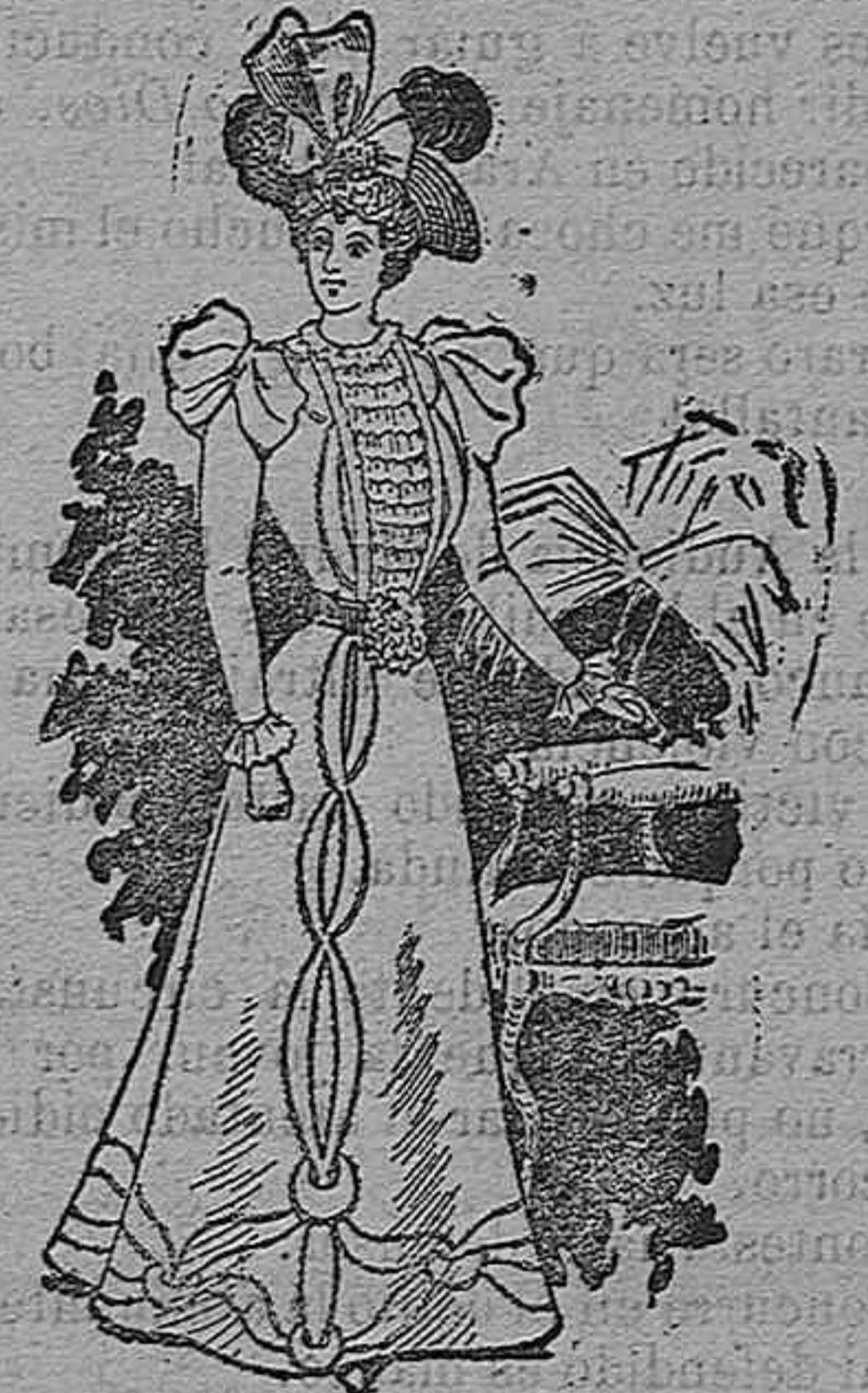
Traje para primavera.

Modelos exclusivos para nuestras lectoras, de los grandes almacenes de EL SIGLO, Barcelona (1).