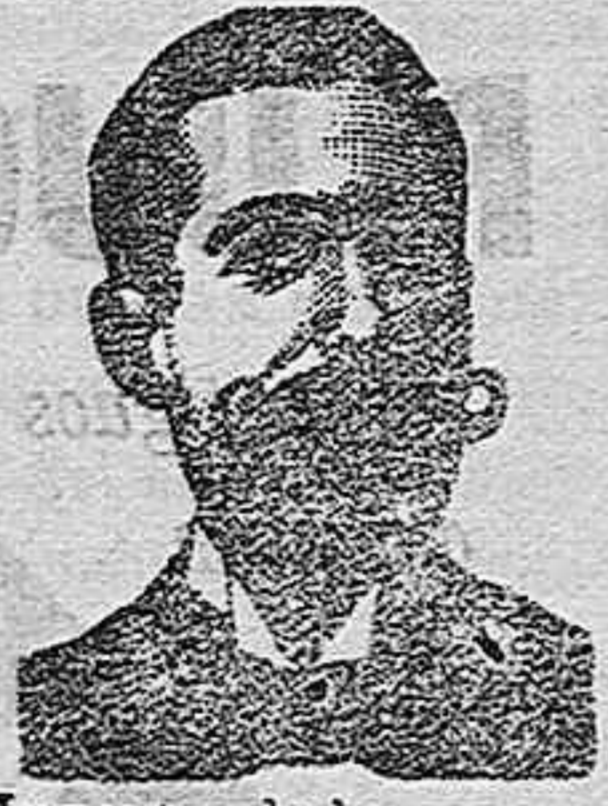
Inventor de los renombrados medicamentos COSTANZI Diputación 435, Baroa.

Y todo lo relativo á construcción y decorado. Catálogos, notas de precios y presupuestos.