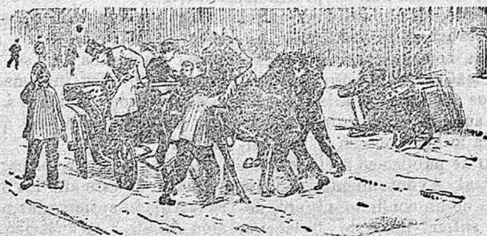
Los hualguistas en Varsovia obligando á los cocheros á abandonar sus vehículos y seguirlos.