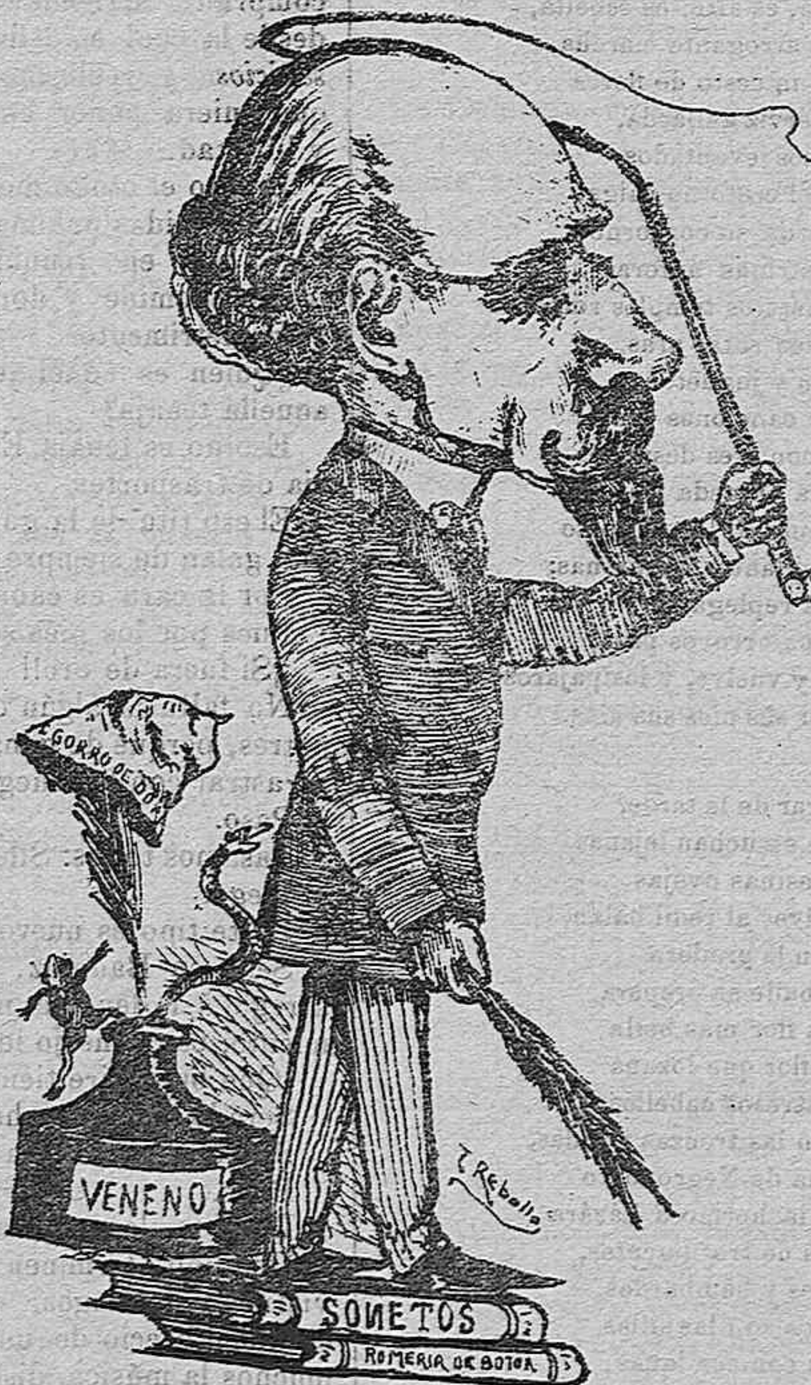
Es un poeta festivo de gran popularidad, tiene talento y escribe con remuchísima sal.