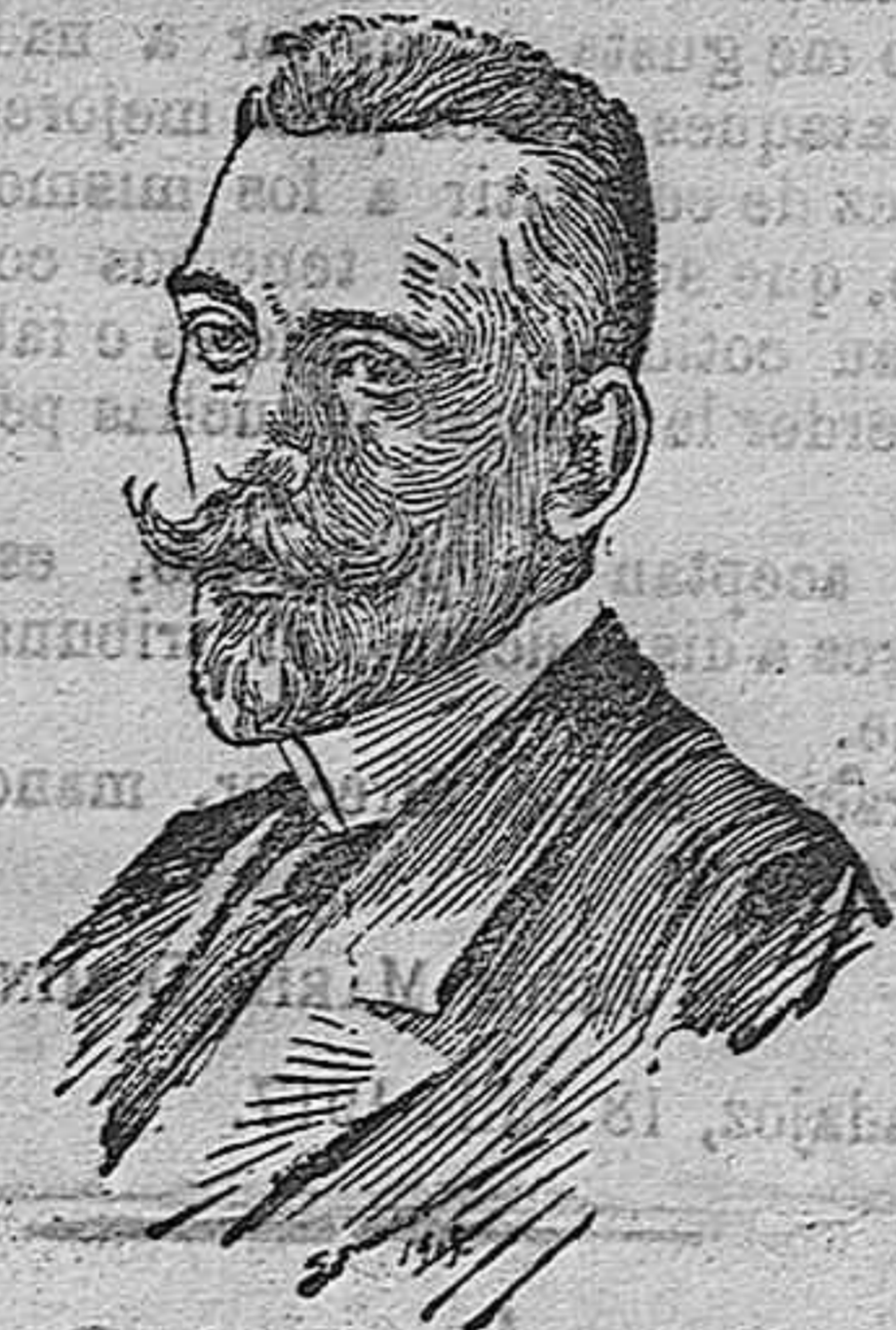
VETHMANN HOLLWEG, canciller dimisionario