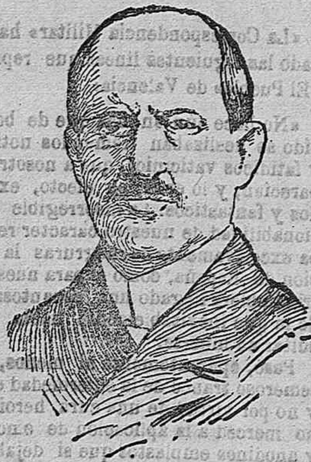
DOCTOR MICHAELIS, nuevo canciller del imperio alemán