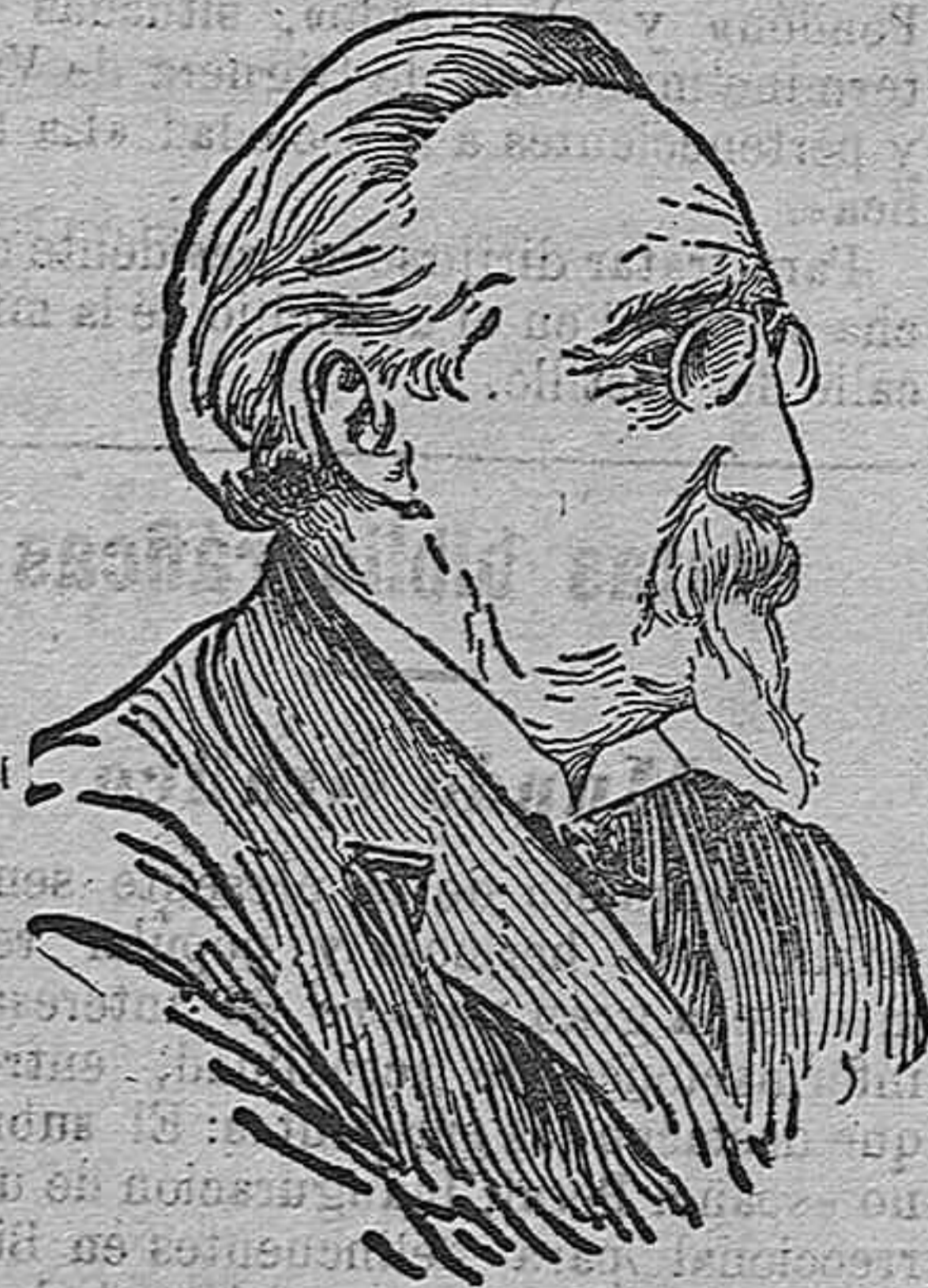
DON MANUEL DE ARRIAGA

Como profesor era una de las figuras más relevantes de la Universidad de Coimbra, la más calificada de Portugal, y de la que fué rector durante mucho tiempo.