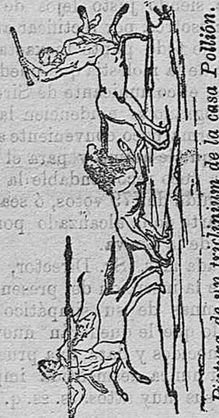
Pintura de un triclinium de la casa Follion.

Según la Historia, Heliogábalo era gran comedor de crestas de gallo crudas, y de lenguas de pavo real y de ruiseñor. Pollión, el famoso político protector de las letras, amigo de Virgilio y de Horacio, cuidaba de las morenas (anguilas de mar) y de otros peces que guardaba en su estanque, obligando a ciertos esclavos a permanecer en el agua hasta que aquellos animales daban fin de ellos, después de recibir los infelices múltiples heridas. Esto, según Pollión, daba a los pescados un grado superior de fineza y sabor exquisito.