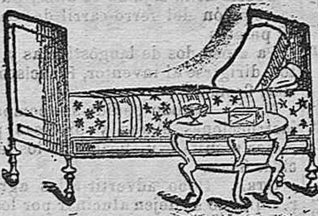
Lecho y mesa de una casa romana (De una pintura de Pompeya)

En tiempo de los galos la ornamentación de la mesa era suntuosa. Cuernos de buey que eran perfectos trabajos de orfebrería, servían de copas. Los platos que usaban los ricos eran de plata ó de cobre y los de los pobres de madera ó de tierra.