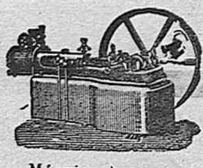
Máquina de vapor horizontal.