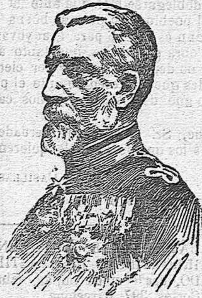
Carlos I de Rumania

Claro que esta es la estadística oficial, pero el hecho real es que en 1912 el número total y general de emigrantes debe acercarse mucho a 250.000.