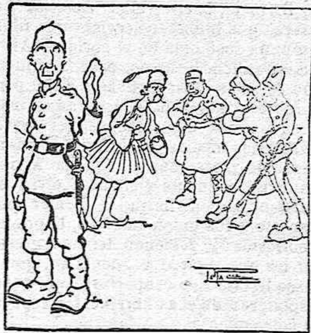
La actualidad humorística

Ya verán como al fin este será el final de la tragedia de que he sido víctima.