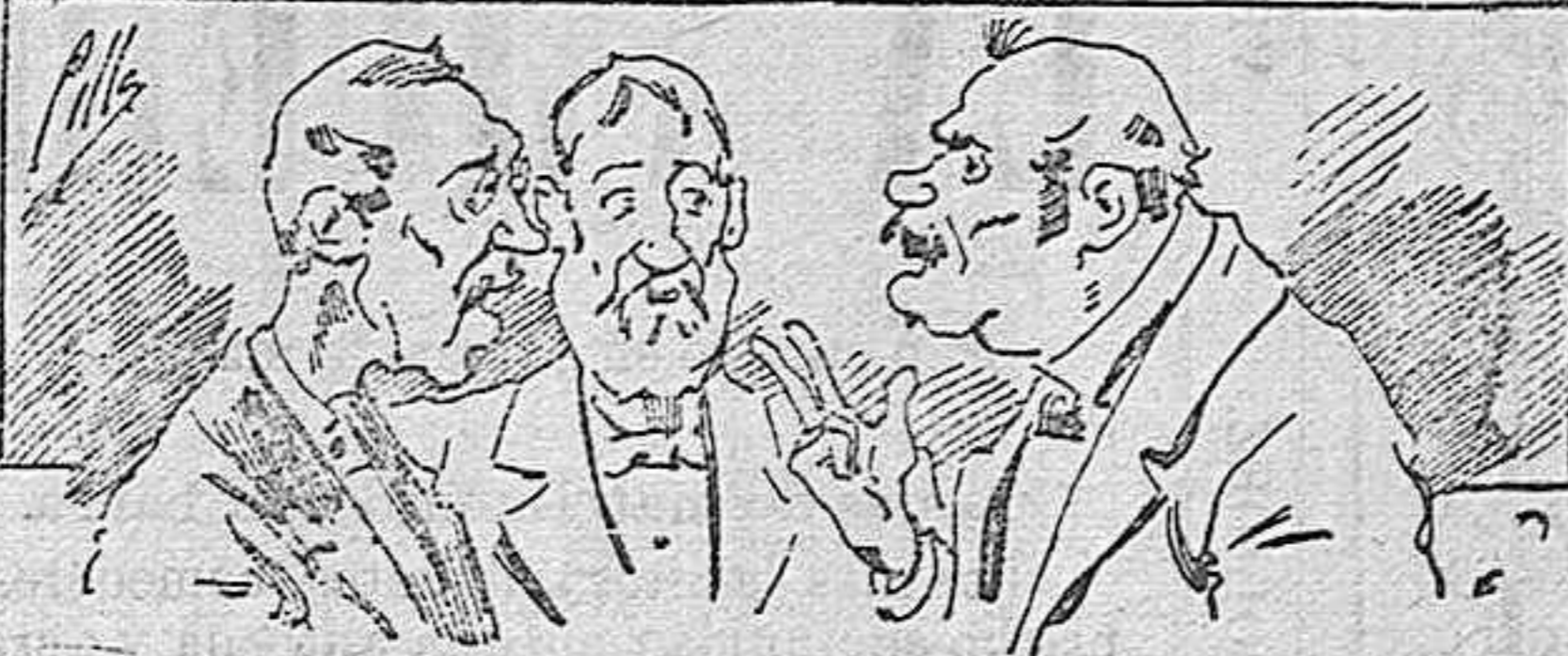
Ahominan á nuestros libros....., pero los compran.

Todas las personas de gusto, curiosas é ilustradas deben pedir al Director de LA AVISPA, apartado núm. 8, MADRID, un ejemplar que se remite gratis y franqueado. Esta Revista Enciclopédica Popular publica recreaciones científicas, recetas de cocina, repostería, confitería, vinos, licores, pinturas, barnices, betunes y fórmulas para toda clase de industria, y cuantas noticias y conocimientos puedan ser beneficiosos. Cuenta además con buenos grabados, parte literaria excelente; da regalos mensuales á sus lectores con la Lotería Nacional y participaciones en la misma, á cuyo efecto compra todos los sorteos, y en una de las Administraciones más afortunadas por la suerte, billetes enteros. La suscripción y los números que se nos pidan se sirven gratuitamente á correo vuelto y franqueados, con sólo indicar el nombre y dirección del que lo desea en sobre dirigido al Sr. Administrador de