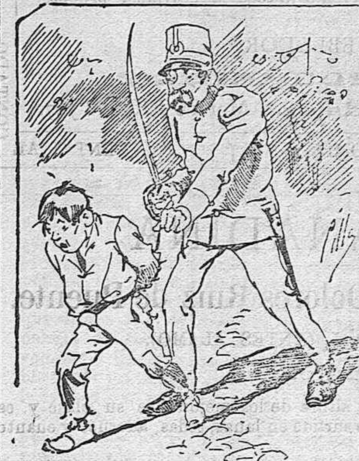
Tratamientos de la policía á nuestros vendedores cuando el número pica.....