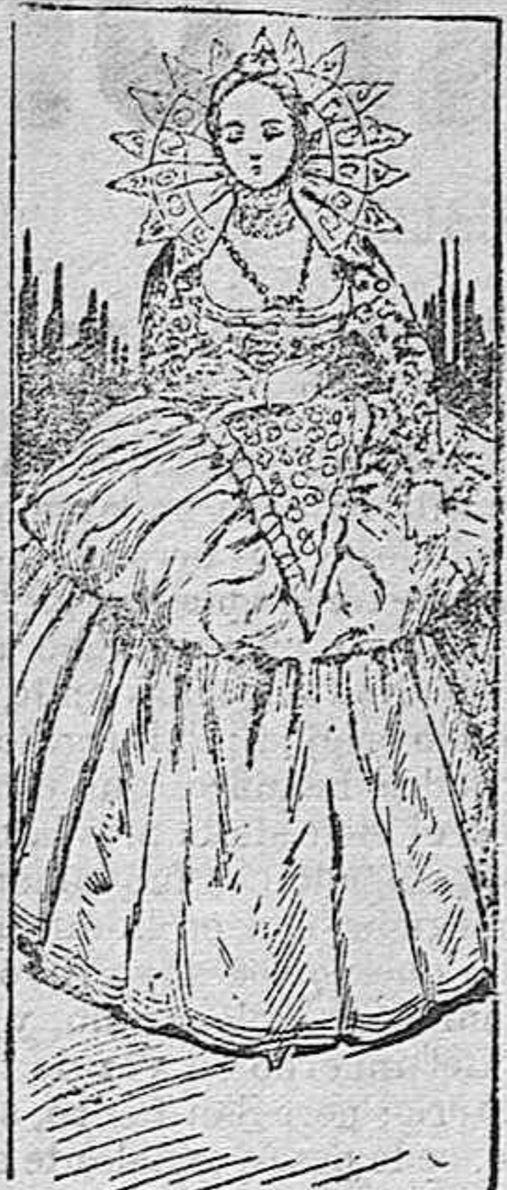
TRAJE DISFRAZ DE DAMA INGLESA DEL SIGLO XVI

Modelos exclusivos para nuestras lectoras de los grandes almacenes de EL SIGLO, Barcelona.