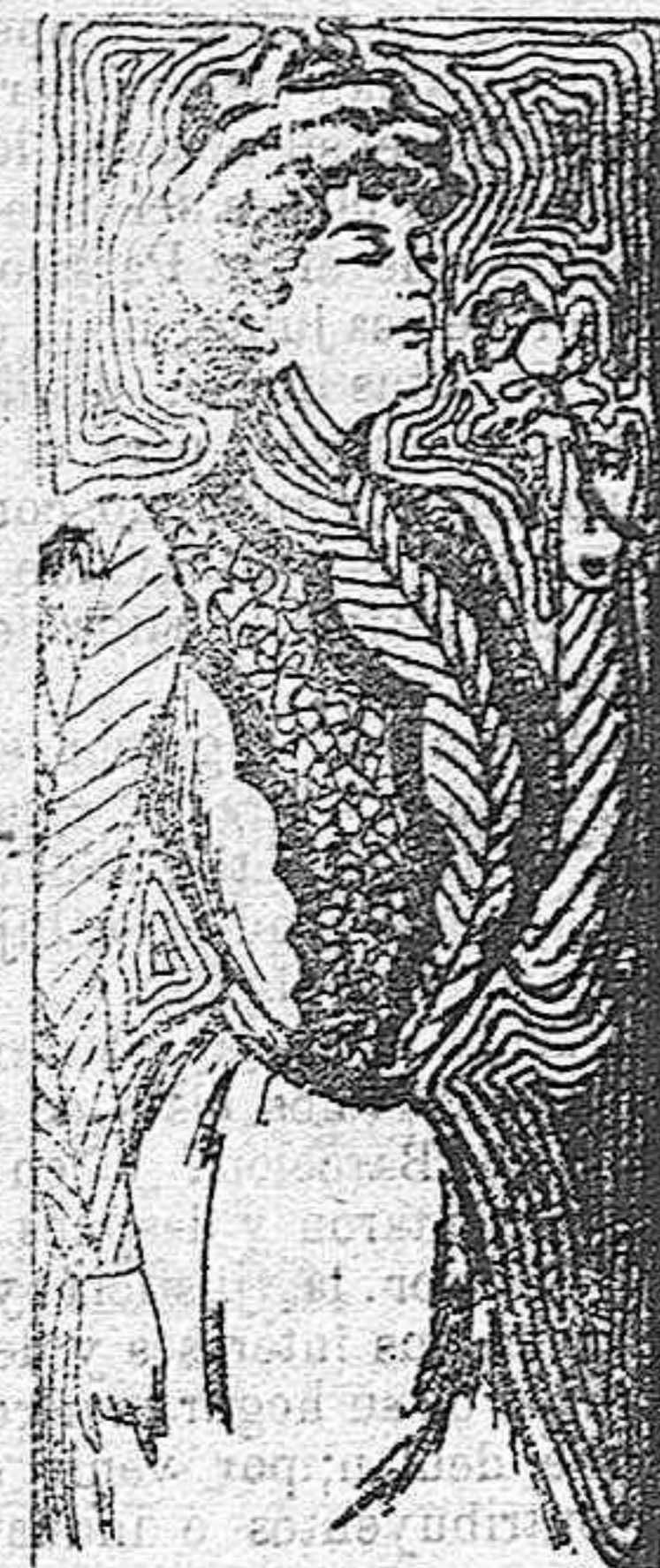
Traje para señorita.

Modelos exclusivos para nuestras lectoras de los grandes almacenes de EL SIGLO, Barcelona.