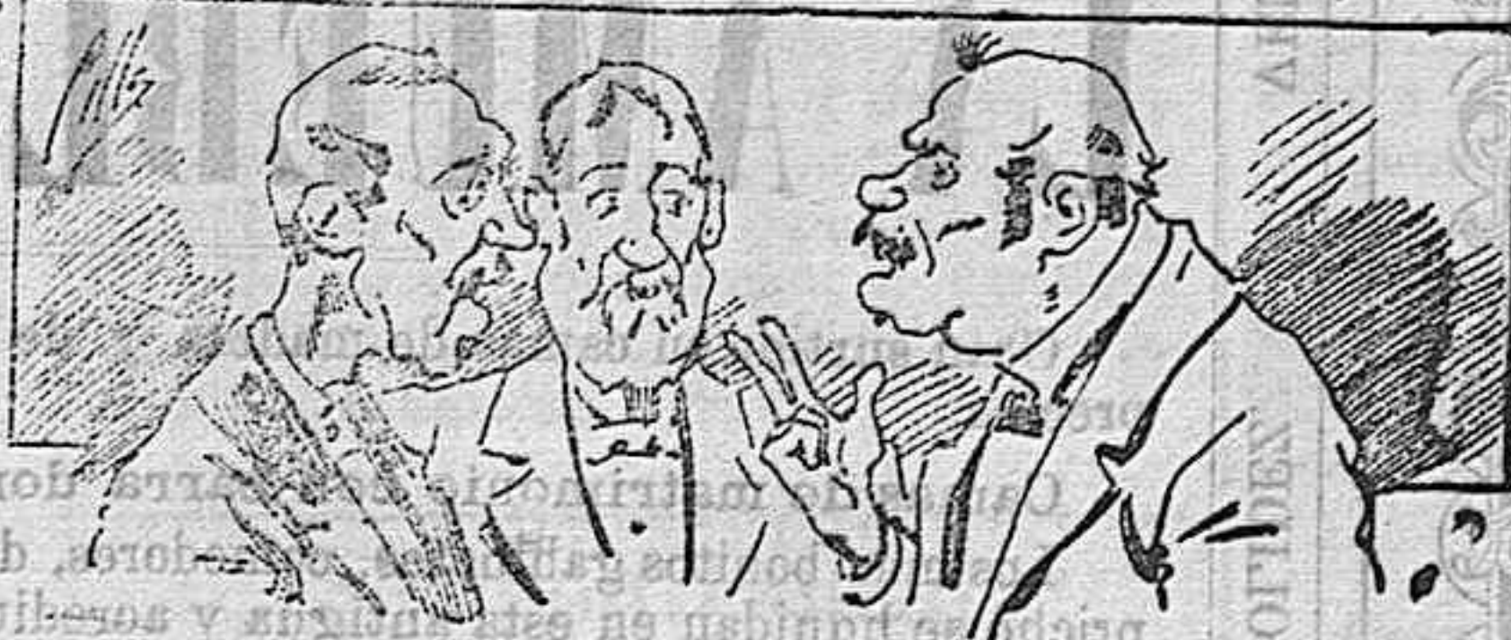
Ahí van á nuestros libros... pero los compran.

Todas las... de gusto, curiosas é ilustradas debe... Director de LA AVISPA, apartado núm. 8, un ejemplar que se remite gratis y franqueado... la revista Enciclopédica Popular publica recreaciones científicas, recetas de cocina, repostería, confitería, vinos, licores, pinturas, barnices, betunes y fórmulas para toda clase de industria, y cuantas noticias y conocimientos puedan ser beneficiosos. Cuenta además con buenos grabados, parte literaria excelente; da regalos mensuales á sus lectores con la Lotería Nacional y participaciones en la misma, á cuyo efecto compra todos los sorteos, y en una de las Administraciones más afortunadas por la suerte, billetes enteros. La suscripción y los números que se nos pidan se sirven gratuitamente á correo vuelto y franqueados, con sólo indicar el nombre y dirección del que lo desea en sobre dirigido al Sr. Administrador de