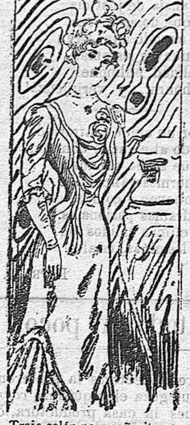
Traje salón para señorita.

Modelos exclusivos para nuestras lectoras de los grandes almacenes de EL SIGLO, Barcelona.