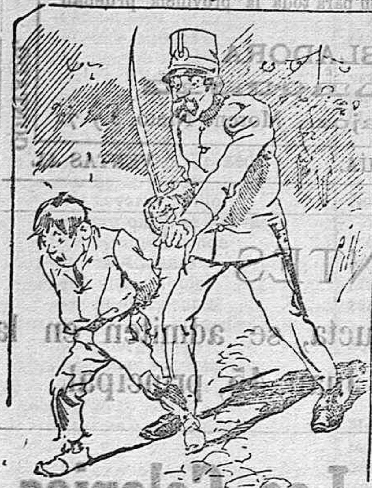
Tratamientos de la policía á nue tros vendedores cuando el número pica...