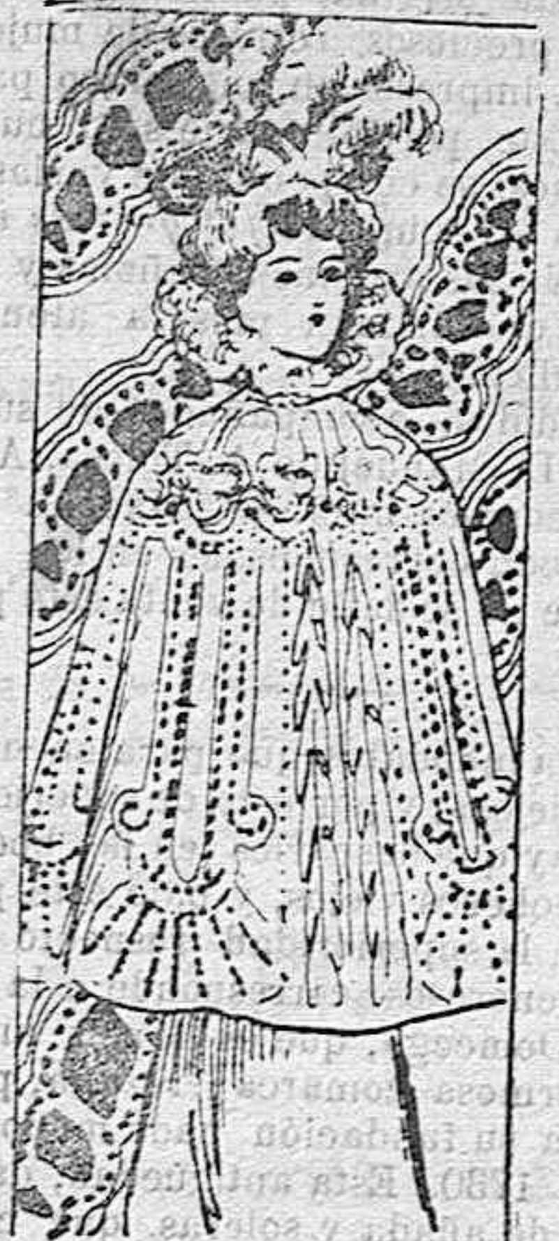
CAPA PARA SEÑORA

Modelos exclusivos para nuestras lectoras de los grandes almacenes de EL SIGLO, Barcelona.