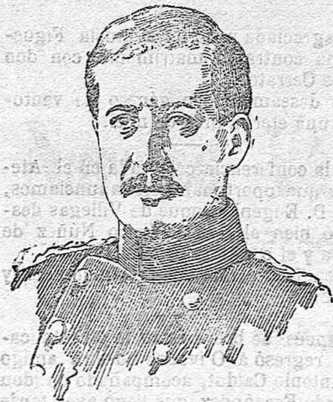
El rey Alberto de Bélgica

«Marcha con ese paso mesurado que indica una reflexión profunda. Su mirada se para distraída en el camino ó en las aguas; es la mirada del que piensa y no ve. Una gravedad imponente se transparaenta en su cara.