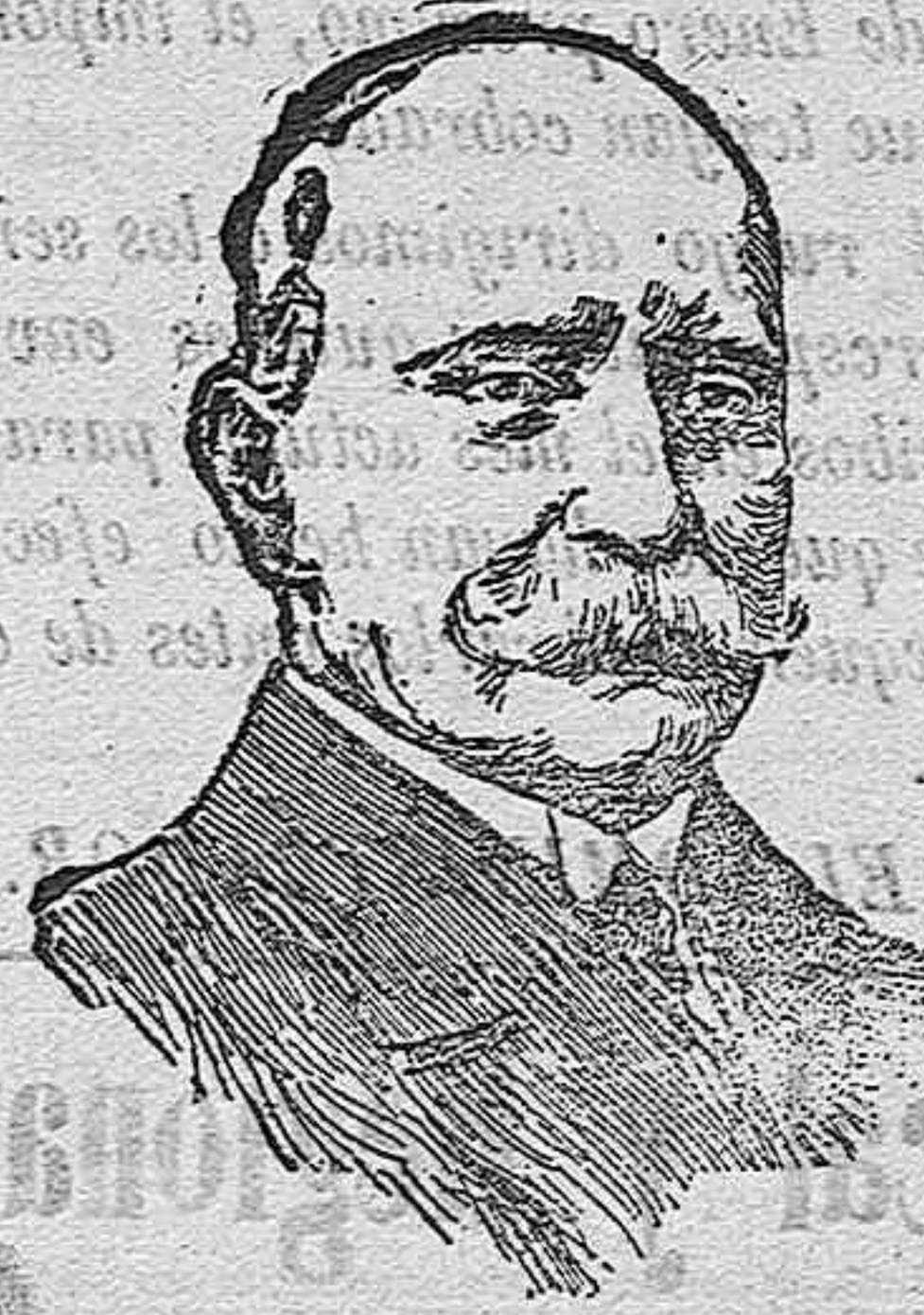
EL CONDE ZEPPELIN

que pilotaba el dirigible de su nombre, que recientemente voló sobre Nancy bombardeando sus defensas