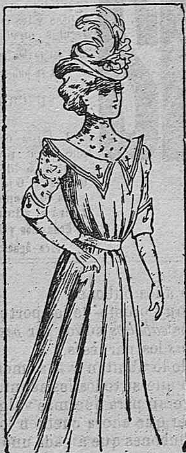
Traje para señorita

Modelos exclusivos para nuestras lectoras, de los grandes almacenes de EL SIGLO, Barcelona.