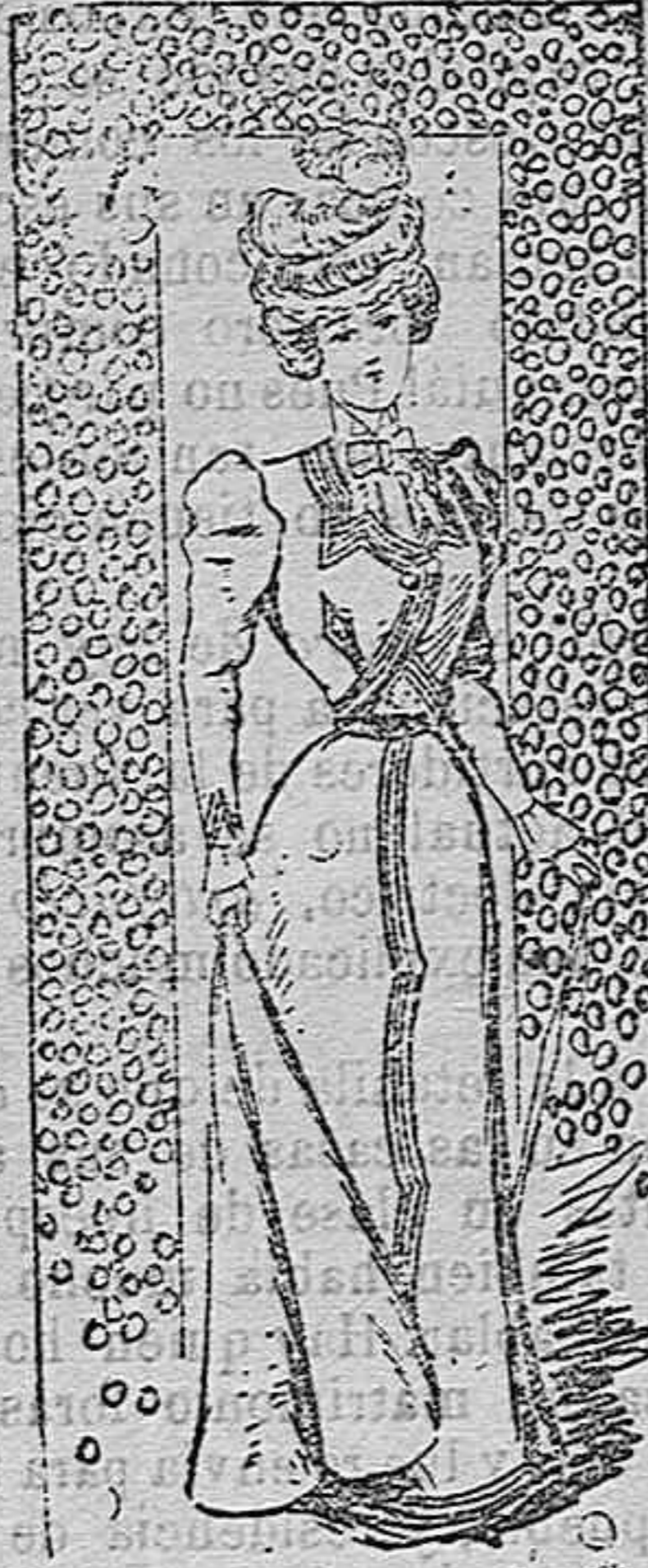
Traje para señorita.

Modelos exclusivos para nuestras lectoras, de los grandes almacenes de EL SIGLO, Barcelona (I).