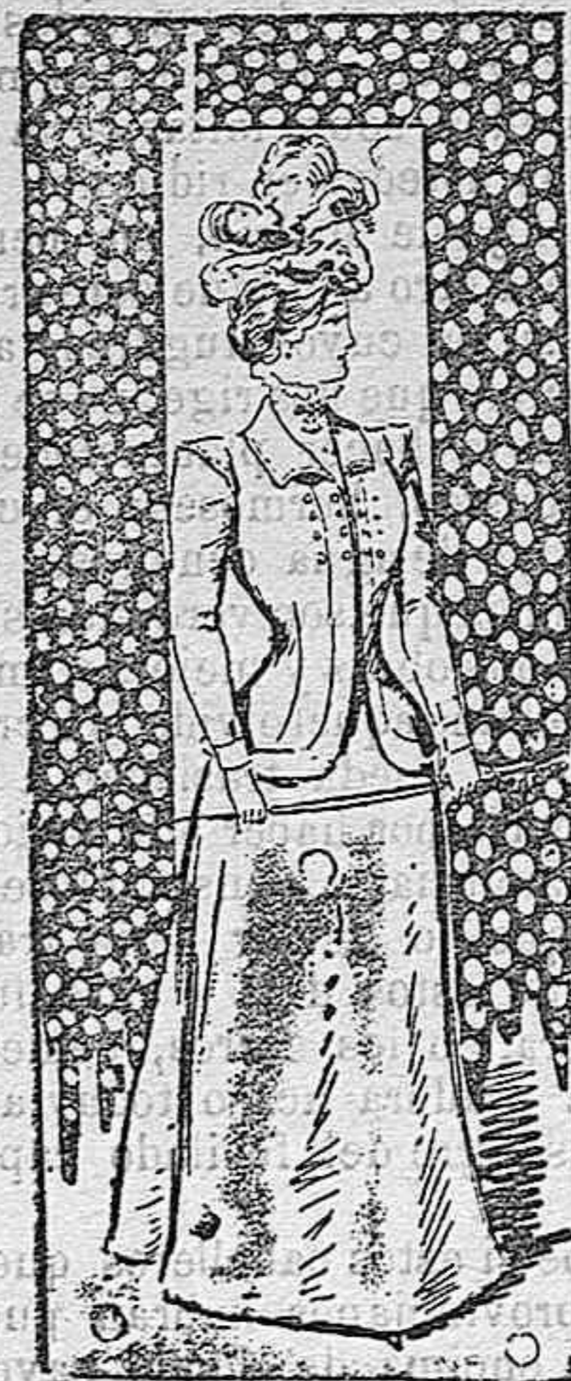
Traje para señora.

De alpaca gris. Torera adornada con bieses de raso y sujeta por dos botones de cristal. Camisolín de gasa y cuello con corbata. Mangas estrechas con bieses en el borde. Falda acampanada y enteramente lisa de cañera, sin pliegues ni arrugas por detrás, solamente adornada la costura con bieses de raso, igual que la parte de delante.