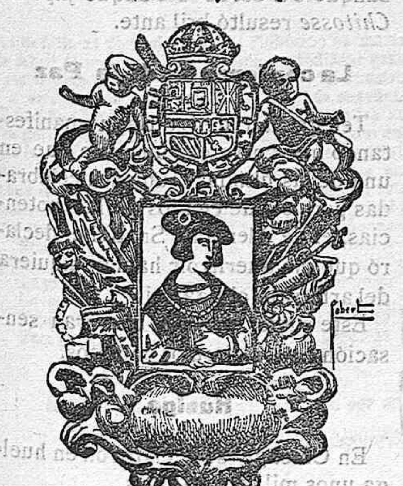
Retrato de Carlos V con el Toisón

Brujas, la ciudad belga, capital de la provincia de Flandes occidental; era en 1.129 una ciudad de más de 150.000 habitantes, y uno de los más ricos centros industriales del mundo entero; hoy es una población muerta, con escasos 50.000 habitantes.