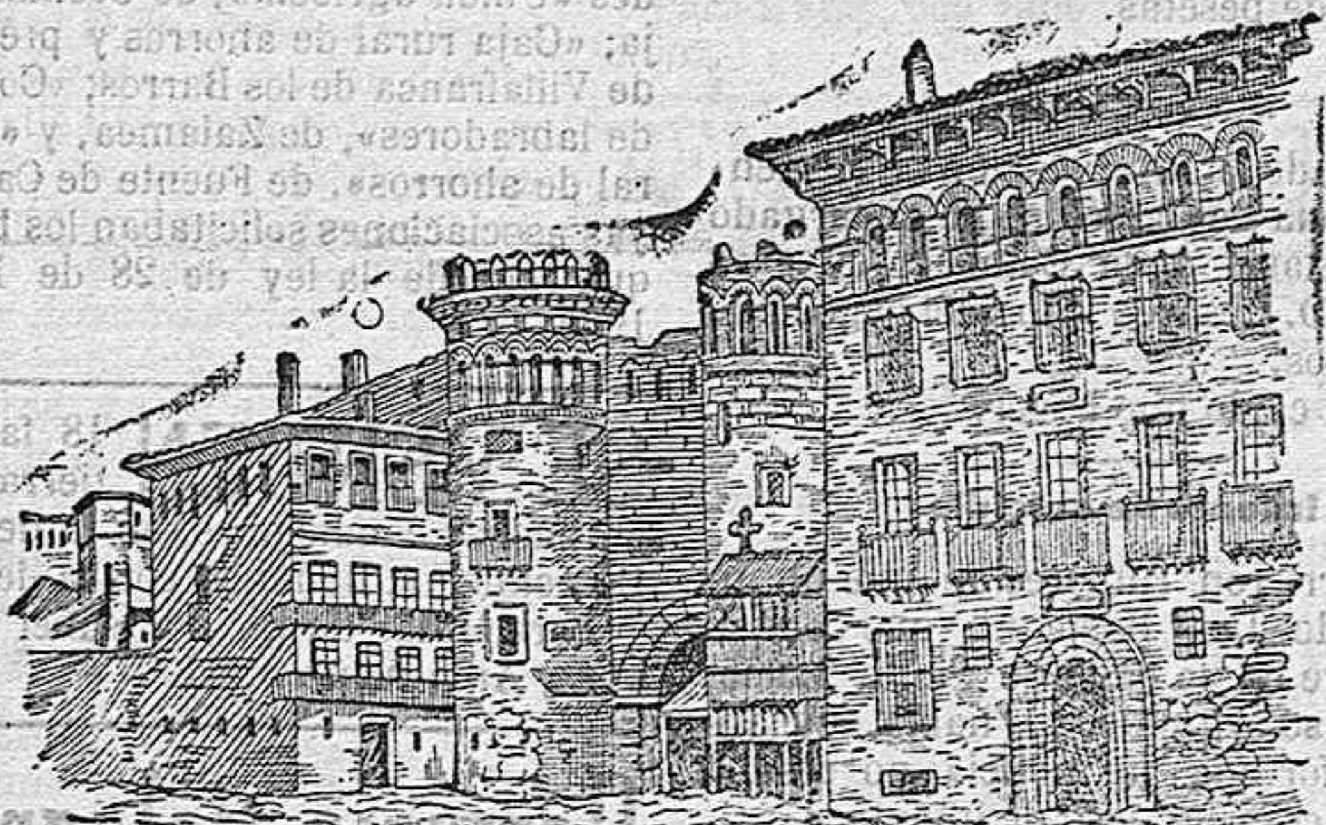
La antigua plaza del Mercado de Zaragoza

Por la importancia histórica que llegó a alcanzar, reproducimos en nuestro grabado la vista de la antigua plaza mercado de Zaragoza, tal como se hallaba a principios del siglo pasado.