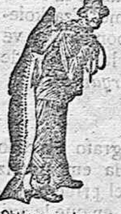
Obténase siempre la Emulsión con esta marca «El Pescador».