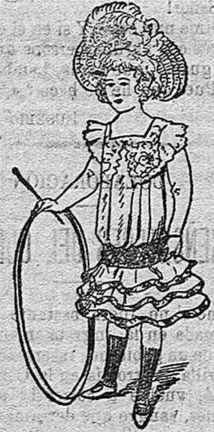
Traje para niña de 6 á 8 años.

Trajecito de tela «velo marfil», de talle bajo y ligeramente ablusado por delante. Pequeña torera de guipur, escotada en cuadro, sobre pecherin de tafetán escocés. Faja de seda. Falda compuesta de tres volantes ribeteados con un biés de tafetán escocés y sombrero de muselina blanca bullonada, pluma también blanca y ancho lazo de color rosa de china.