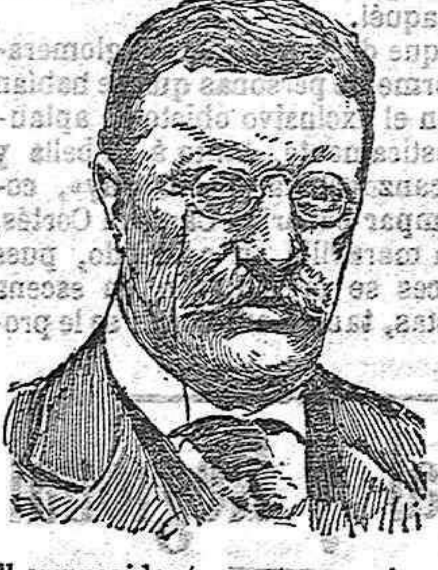
El expresidente norteamericano mister Roosevelt, que actualmente se halla en Madrid, para asistir a la boda de su hijo.