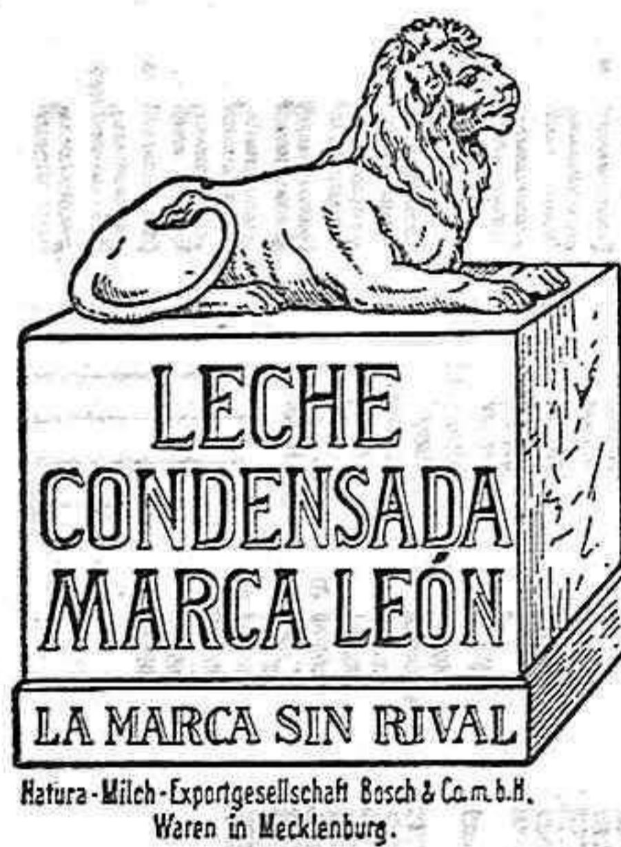
Natura-Milch-Exportgesellschaft Bosch & Co. m. b. H. Waren in Mecklenburg.

La más selecta y sin rival analizada por el doctor Calvet, de Barcelona, garantizándose su pureza, por lo que no se nota lo más mínimo el sabor extraño que tienen otras marcas.