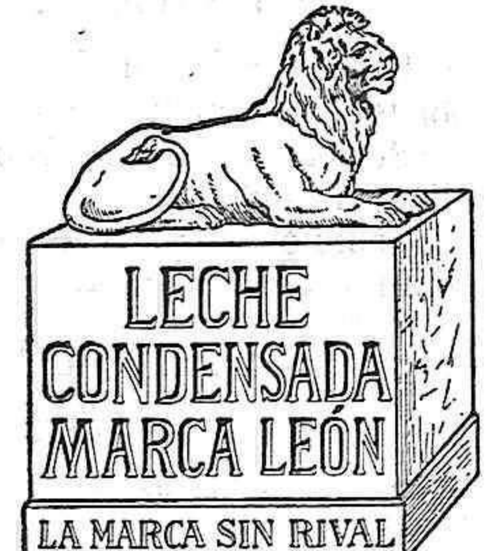
Natura-Milch-Exportgesellschaft Bosch & Co. m. B. Waren in Mecklenburg.

En caso de urgencia endereço telegraphico «Sanlopes, Elvas» são servidas as encomendas dentro de 24 horas.