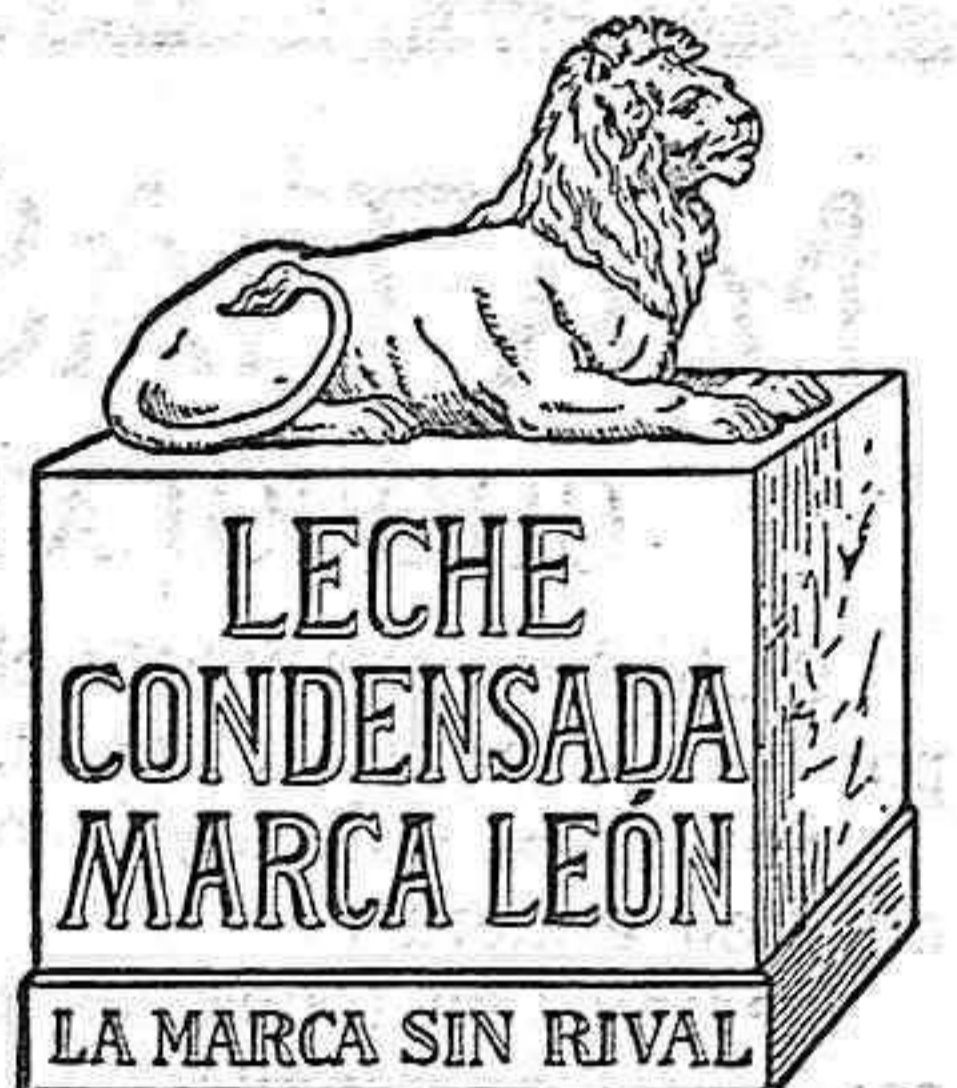
Natura-Milch-Exportgesellschaft Bosch & Co. m. b. H. Waren in Mecklenburg.

Señor de Soto, Martín Cansado 29 y 31, pral., Badajoz