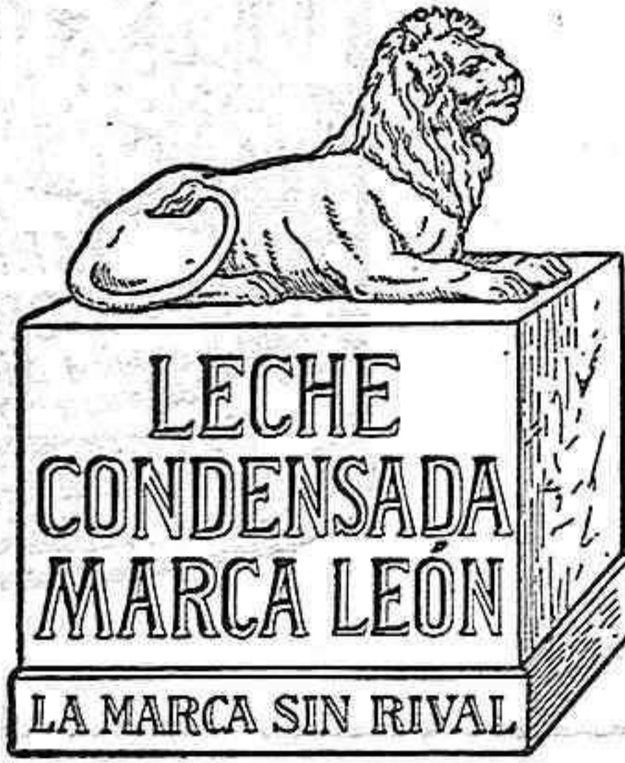
Natura-Milch-Exportgesellschaft Busch & Co. m. b. H. Waren in Mecklenburg.

Precios convencionales, según la mayor ó menor humedad que contengan los muros.