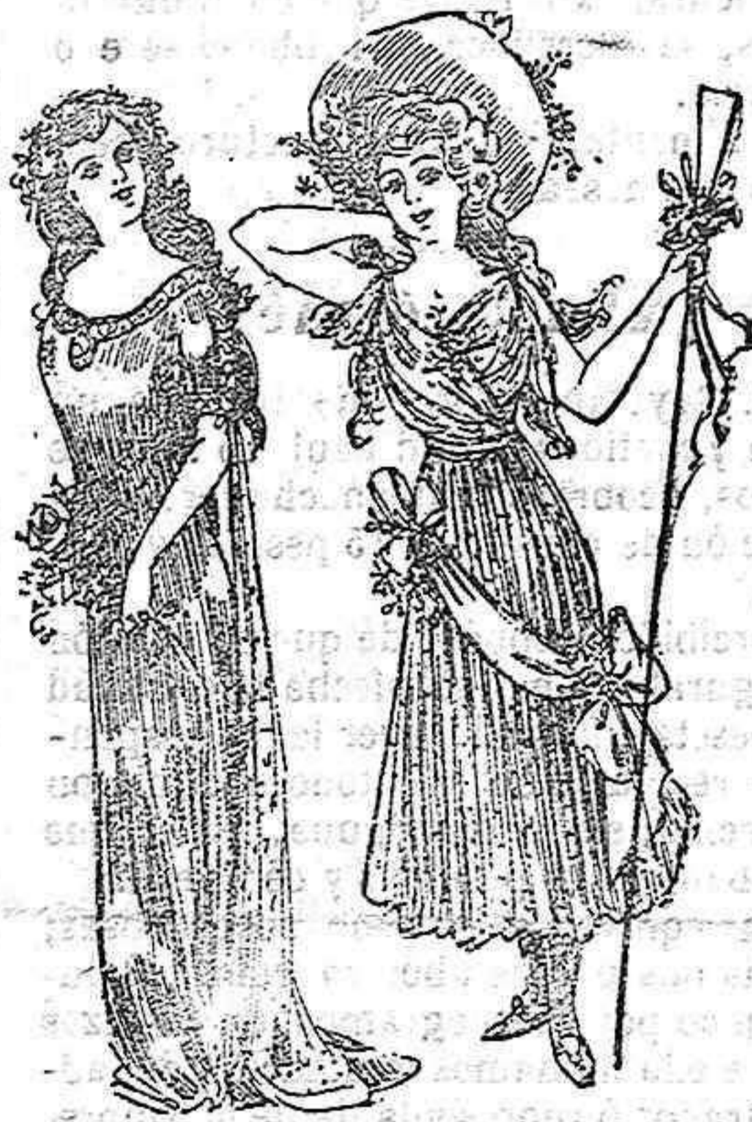
Disfraces para niñas Disfraces de Ofelia y de Primavera