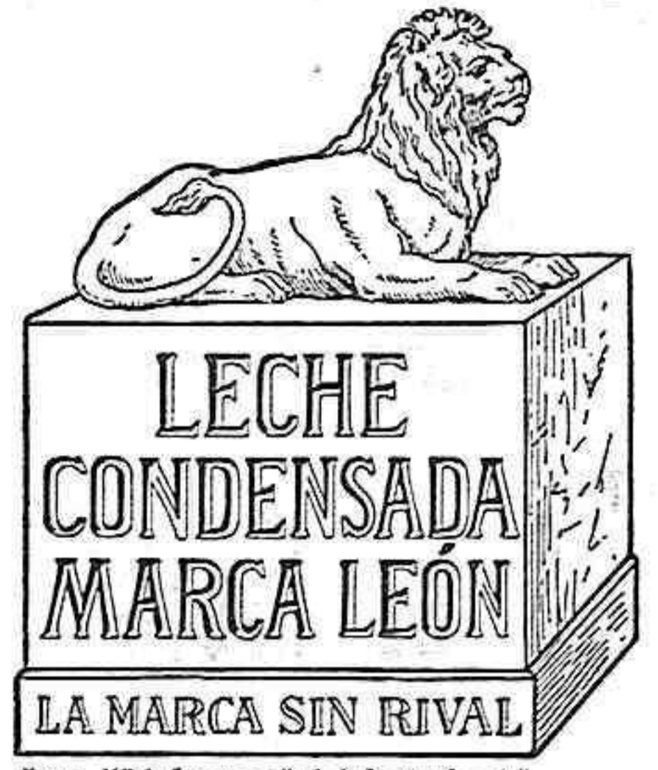
Natura-Milch-Exportgesellschaft Bosch & Co. m. b. H. Waren in Mecklenburg.