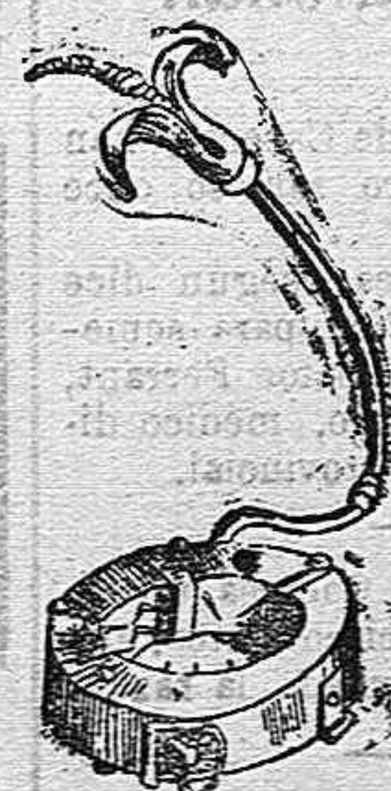
Collar de hierro Al tomarse los bagajes del ejército austriaco halláronse

En el número de los 700 soldados suizos que alcanzaron en 1886 la célebre victoria de Sempach, se contaban 400 hombres de Lucerna, 200 de Waldstätten y 100 de los otros cinco cantones.