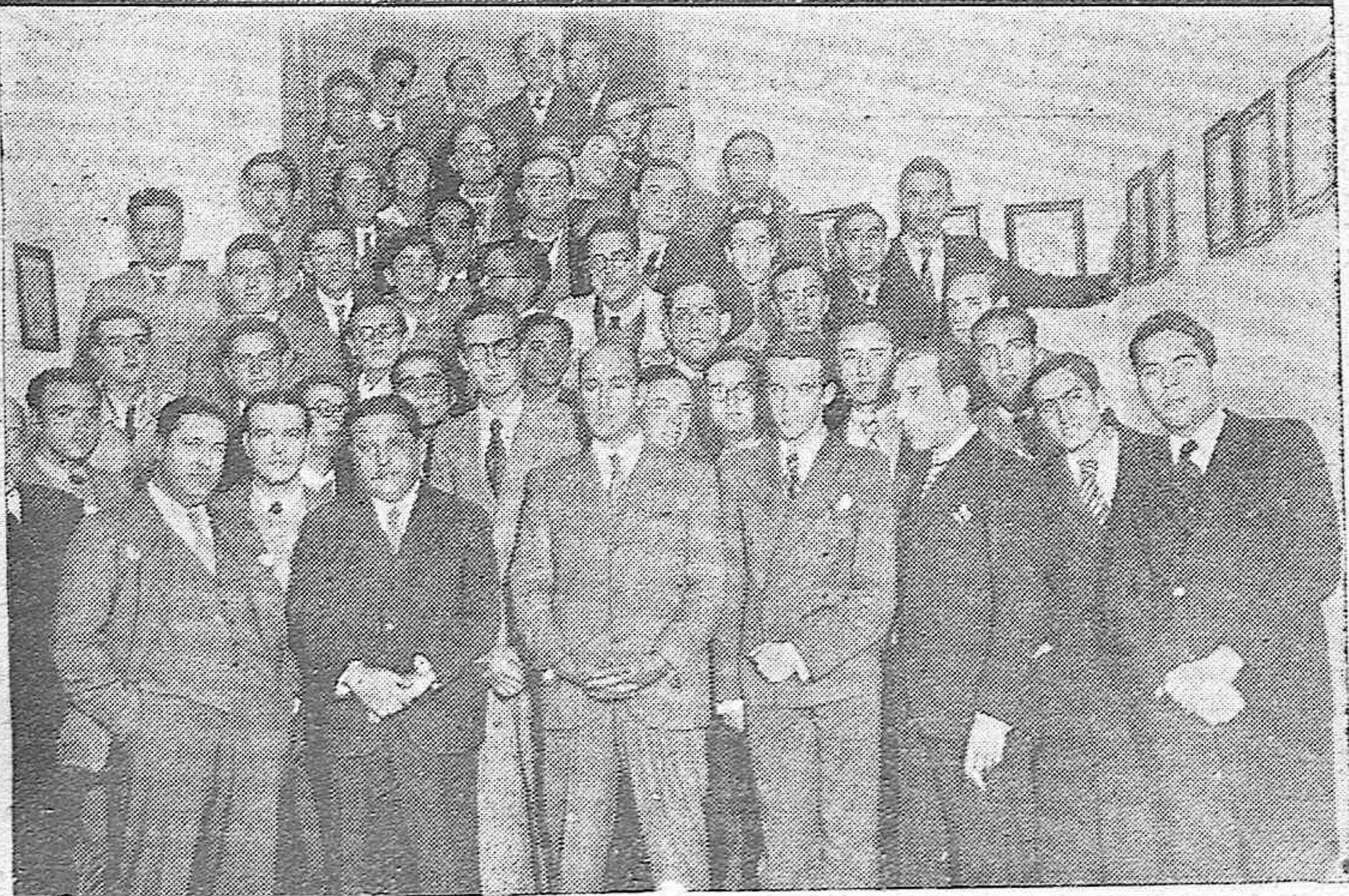
Presidencia del acto organizado por el Ateneo Escolar Veterinario.—Grupo del Ateneo Escolar Veterinario con el Director de la Escuela de Veterinaria al terminar el acto.