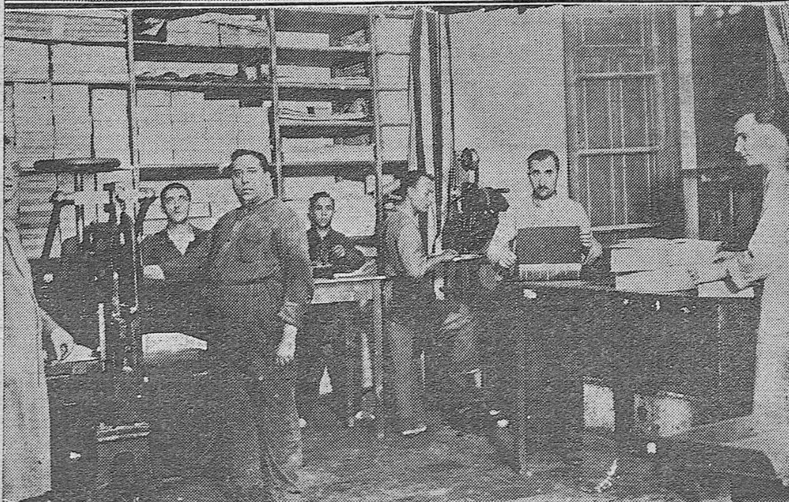
Vista del taller de maquinarias de la Imprenta del Hospicio durante la confección de las listas electorales.— Sala destinada a la encuadernación de las mismas.